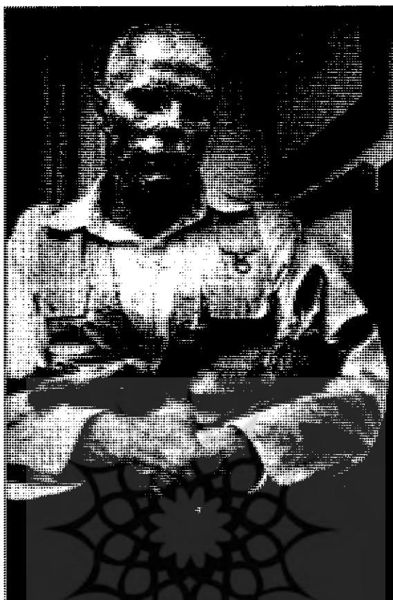
جورف بیوز، چگونه سینمای تصویرها را برای یک گروه مرد توضیح داد، ۱۹۶۵، اجرا در تئاتر خانه ی اسلان، دوسلدورف، آلمان

محدودیت هایی که در قلمرو فیلم های مستند وجود دارد. آیا در تهیه ی این نوع فیلم ها می توان از خط های ممنوعه ی احکام فرعی برای بازنمایاندن عمق فاجعه و یافتن راه حل عبور کرد، درست به همان نحو که یک پزشک برای صدور حکم قطعی به معاینه ی محل درد نیاز دارد. به عنوان مثال، اگر کسی بخواهد مسائل یک پارتمی و پیامدهای آن را برای خانواده ها نشان دهد، چه باید بکند؟ یا اگر فیلم سازی بخواهد آیدز را نشان دهد و تفهیم کند این مریضی چگونه به وجود می آید و چگونه انتقال پیدا می کند و آخرش چیست، چگونه باید عمل کند؟ آیا برای نمایاندن اصل رویداد نباید از موسیقی پاپ و هیجاناتی که از راه آن به شرکت کننده در پارتمی دست می دهد بهره جست؟ آیا نشان دادن شرایط بحرانی که در آن انسان زمینی دل و دین خود را از دست می دهد، اشکال شرعی دارد؟ یا از عدم واقع نگری حوزه حکایت دارد؟ مرز میان واقع نمایی و بدآموزی کجاست؟ آیا در این عصر که عصر تصویر است، بیان نکردن این حقایق سبب نمی شود که بینندگان فیلم های غربی و ماهواره ها فزونی یابند؟