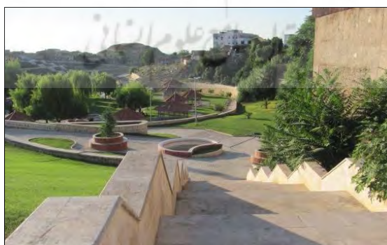
شکل ۳: تصویری از پارک ملت

پارک ملت یکی از پارک‌های تازه تأسیس در گرگان هست. این پارک در محله اسلام‌آباد در خیابان باهنر گرگان ساخته شده است. این بوستان در سال ۱۳۸۵ احداث شده است که مساحتی حدود ۳۵۰۰۰ مترمربع را شامل می‌شود. که ۱۱۵۰ متر فضای بازی