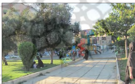
شکل ۵: تصویری از پارک چاله باغ

پارک چاله باغ در مرکز شهر گرگان دارای طبیعت زیبایی بوده که این بوستان را مکانی برای تفریح و تفرج تبدیل کرده است. این پارک در سال ۱۳۷۵ افتتاح گردیده است و مساحتی حدود ۲۸۰۰۰ مترمربع دارا است. این بوستان از سویی به خیابان ۵