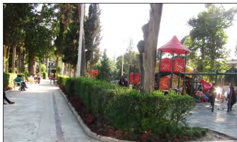
شکل ۴: تصویری از پارک شهر گرگان

از قبیل سرویس‌های بهداشتی و روشنایی شامل کتابخانه، موزه زمین ورزشی، وسایل بازی و ورزش و آلاچیق‌هایی برای اقامت موقت بازدیدکنندگان و گردشگران می‌باشد. در کل این پارک ۳۸۰۰۰