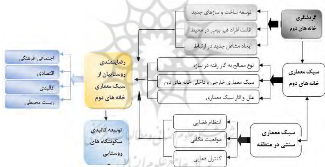
شکل ۲: مدل مفهومی تحقیق

شدیدتری در فرم- معماری و استفاده از مصالح ساختمانی شبیه به مسکن شهری هستند. یکی از این موارد که باعث تشدید این امر شده گسترش خانه‌های دوم روستایی با معماری شهری در روستاهاست. گسترش بی‌رویه خانه‌های ویلایی در نواحی روستایی و تعداد انبوه وسایل نقلیه در محورهای منتهی به این نواحی بیانگر روند افزایشی این پدیده است. در زمینه پیامدهای توسعه گردشگری خانه‌های دوم با تأکید بر سبک معماری خانه‌های دوم و ساخت‌وسازهای بی‌رویه، دخل و تصرف گسترده و کنترل نشده در محیط طبیعی را نشان می‌دهند (مهدوی حاجیلوئی، ۱۳۸۷: ۳۲). اقداماتی از قبیل استفاده از مصالح و الگوی معماری ناهمگون با محیط، برهم زدن و تخریب چشم‌انداز روستا و تغییر فضاهای معیشتی مسکن