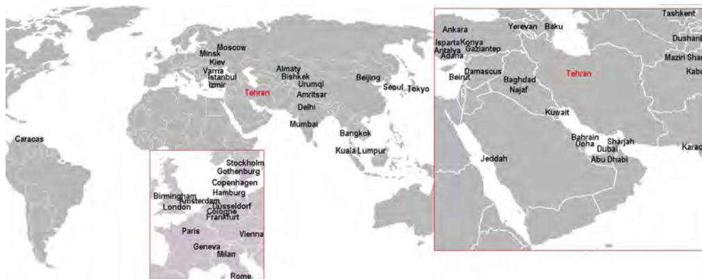
شکل ۳- شبکه پروازی فرودگاه‌های بین‌المللی جهان به فرودگاه امام خمینی (ره) ۱۳۸۶

مولفه‌های فوق‌الگوی سری زمانی به کار گرفته شده در این تحقیق به شرح زیر می‌باشد: