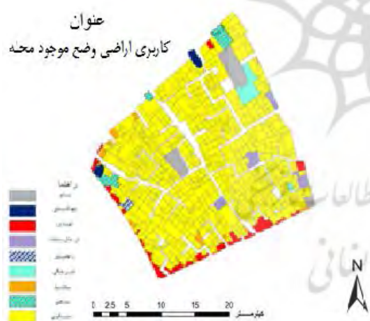
شکل ۲: کاربری اراضی وضع موجود محله جولان باز ترسیم: نگارندگان (۱۳۹۴).