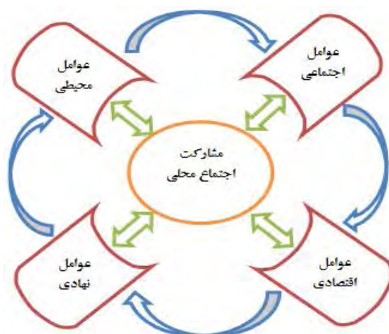
شکل ۱- عوامل مؤثر بر مشارکت جامعه محلی

متغیرها و اهداف مورد نظر، از روش آماری توصیفی نظیر میانگین رتبه پاسخ‌ها، روش‌های تحلیل آماری