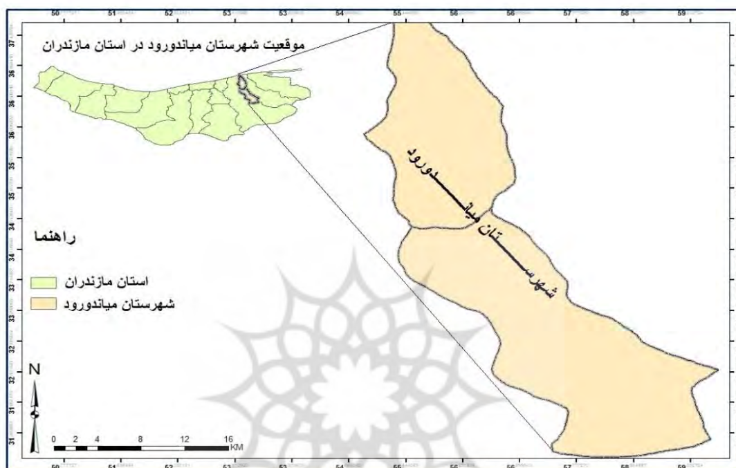
شکل ۳: نقشه موقعیت جغرافیایی شهرستان میاندورود در استان مازندران

مربع می باشد. به لحاظ قرار گیری مکان جغرافیایی، قسمت جنوبی این شهرستان با شیب بیشتر از شمال به جنگل مازندران و قسمت شمال آن با شیب خیلی ملایم‌تر به دریا ختم می شود. این منطقه دارای جاذبه‌های متنوع است (جدول ۳).