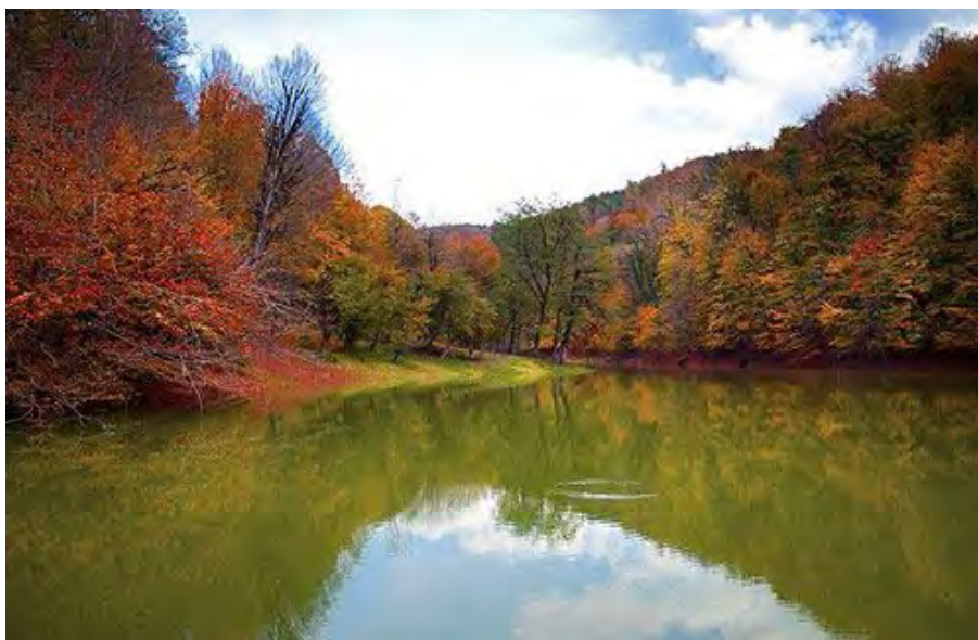
شکل ۱: نمایی از دریاچه چورت ساری سازمان میراث فرهنگی و گردشگری استان مازنداران