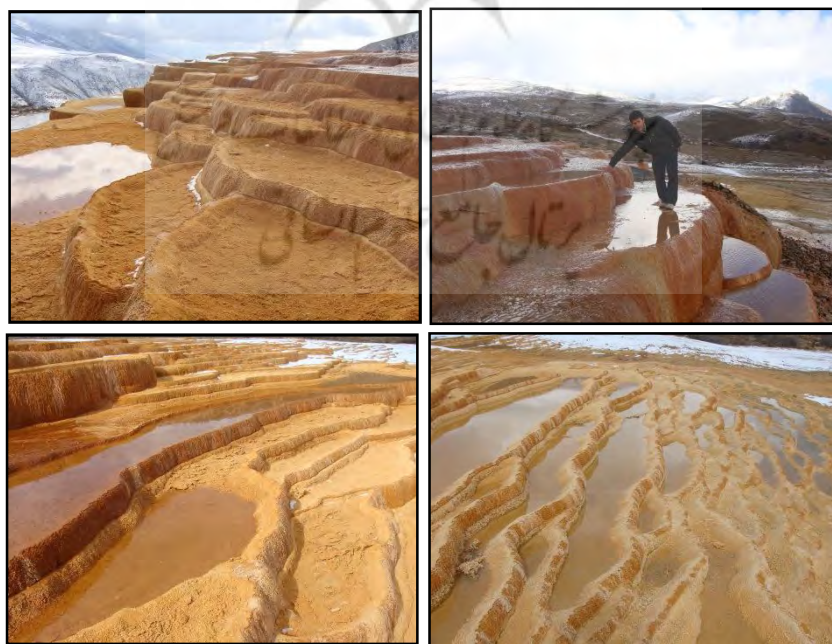
شکل ۲: نمایی از چشمه های باداب سورت سازمان میراث فرهنگی و گردشگری استان مازنداران