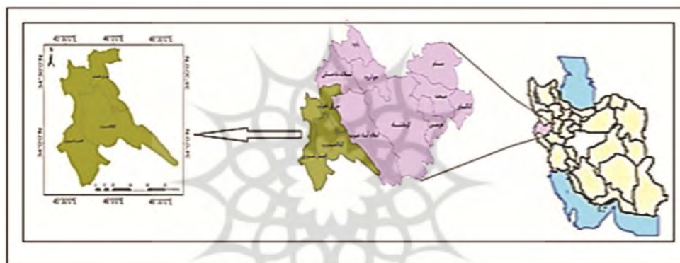
شکل ۱- موقعیت جغرافیایی قطب گردشگری قصرشیرین

گستره استان کرمانشاه با مساحتی ۲۴۴۹۳/۲۵ کیلومترمربع حدود ۱/۴۵ درصد از مساحت کل ایران را دارا می‌باشد که با ۱۴ شهرستان در غرب کشور قرار دارد (سالنامه آماری استان کرمانشاه، ۱۳۹۰). استان کرمانشاه در همه زمینه‌های گردشگری دارای پتانسیل‌های زیادی است بر این اساس با توجه به تقسیم بندی‌های صورت گرفته در طرح جامع گردشگری، استان به ۵ قطب گردشگری تقسیم شده است که هر کدام از این قطب‌ها شهرستان‌هایی را تحت پوشش قرار می‌دهند. قطب گردشگری قصرشیرین به عنوان یکی از قطب‌های گردشگری استان در غرب استان کرمانشاه قرار گرفته که شامل شهرستان‌های قصرشیرین، گیلانغرب و سرپل ذهاب می‌باشد (شکل ۱).