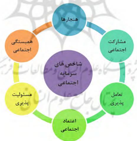
شکل ۱- شاخص‌های سرمایه اجتماعی

انسجام و همبستگی اجتماعی: انسجام اجتماعی به معنای آن است که گروه وحدت خود را حفظ کرده و با عناصر وحدت‌بخش خود تطابق و هم‌نوایی داشته باشد. همبستگی و انسجام، احساس مسئولیت بین چند نفر یا چند گروه است که از آگاهی و اراده برخوردار باشند و حائز یک معنای اخلاقی است که متضمن وجود اندیشه یک وظیفه یا الزام متقابل است و نیز یک معنای مثبت از آن بر می‌آید که وابستگی متقابل کارکردها، اجزا و یا موجودات در یک کل ساخت یافته را می‌رساند. در دیدگاه جامعه‌شناسی، همبستگی پدیده‌ای است که بر اساس آن در سطح یک گروه یا یک جامعه، اعضا به یکدیگر وابسته و به طور متقابل نیازمند یکدیگر هستند. این امر مستلزم طرد آگاهی و نفی اخلاقی مبتنی بر تقابل و مسئولیت نیست بلکه دعوت به احراز و کسب این ارزش‌ها و احساس الزام متقابل است (همان به نقل از بیرو، ۱۳۹۲: ۳۹).