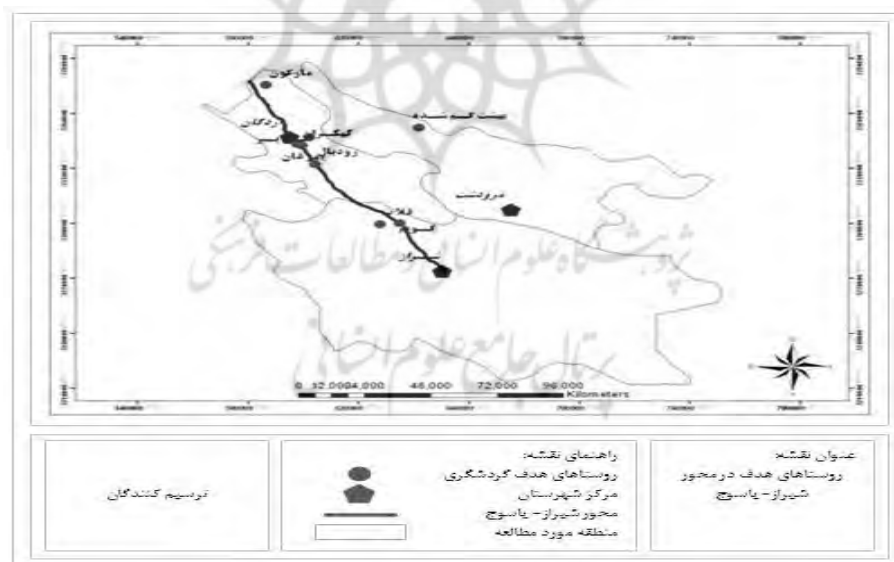
شکل ۱. روستاهای هدف در محور شیراز- یاسوج