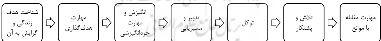
نمودار (۱) مؤلفه‌های سازه امید با رویکرد اسلامی

سازه امید با رویکرد اسلامی هفت مؤلفه دارد که عبارت است از: شناخت هدف زندگی و گرایش به آن، مهارت‌های هدف‌گذاری، انگیزش و مهارت خودانگیزشی، توکل، تدبیر و مسیریابی، تلاش و پشتکار و مهارت مقابله با موانع. این هفت مؤلفه بر یکدیگر اثر متقابل دارد. با شناخت هدف زندگی و گرایش به آن، در فرد احساس معنای معنوی ایجاد می‌شود و هر لحظه زندگی را فرصتی برای تقرب به خدا ارزیابی می‌کند. با مهارت هدف‌گذاری، فرد اهداف مناسبی را در حیطه‌های مختلف تعیین می‌کند و انگیزه معنوی بالایی در جهت دستیابی به اهداف دارد، مهارت‌هایی برای افزایش انگیزش خود به کار می‌برد، برنامه‌ها و مسیرهایی را برای دستیابی به اهداف تدبیر و در جهت دستیابی به اهداف تلاش و با توجه به قدرت و مهربانی بی‌نهایت خدا به او توکل می‌کند و موانع را به خوبی پیش‌بینی و با آنها مقابله می‌نماید. رابطه مؤلفه‌ها در نمودار ۱ نشان داده شده است.