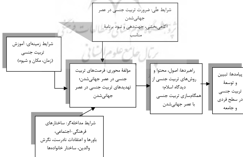
شکل ۱) کدگذاری محوری الگوی تربیت جنسی در عصر جهانی‌شدن با تأکید بر رویکرد اسلام

پس از مرحله کدگذاری باز، نوبت به چینش مؤلفه‌های به‌دست‌آمده در قالب الگوی نظری و حول محور مؤلفه اصلی رسید. در شکل شماره ۱، کدگذاری محوری الگوی اسلامی تربیت جنسی در عصر جهانی‌شدن ترسیم شده است که در آن روابط بین شرایط علی، پدیده محوری، شرایط زمینه‌ای، شرایط مداخله‌گر، راهبردها و پیامدها مشهود است. هدف نظریه داده‌محور تولید نظریه است نه توصیف پدیده‌ها. برای تبدیل تحلیل‌ها به نظریه، مؤلفه‌ها باید به‌طور منظم به یکدیگر مربوط شود. کدگذاری انتخابی مرحله اصلی نظریه‌پردازی است؛ به این ترتیب که مؤلفه محوری را به‌شکل