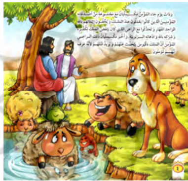
تصویر ۶ رابطه افزایشی میان متن و تصویر داستان «الكلب الحارس» (الکندی، ۲۰۰۹: ۴)

در داستان «البقرة النادرة» در تصویر صفحه ۸ افزون بر این که مفهوم متن را در خود دارد، داستانی گسترده‌تر اما با همان درون‌مایه، بیان می‌کند و آن را گسترش می‌دهند. در تصویر این صفحه دو گاو ناراحت و خشمگین ترسیم شده‌است که به گاو می‌دهند. در حال بازی و شادی همراه با صاحبش است حسادت می‌ورزند. اما در هیچ جای متن داستانی از این تصاویر خبری نیست. تصویرگر در صفحه ۴ داستان «الكلب الحارس» با به تصویر کشیدن بازی و شادی حیوانات بزه، ماهی و قورباغه که در پیشبرد حیاتی داستان نقشی ندارند، بر هیجان داستان و نگاه کودک و بازخورد او از متن و تصویر تاثیر می‌گذارد.