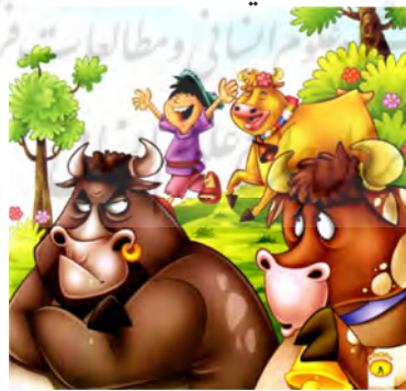
تصویر ۷ رابطه افزایشی میان متن و تصویر داستان «البقرة النادرة» (الکندی، ۲۰۰۹: ۸)