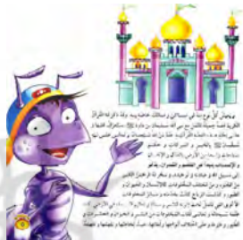
تصویر ۵ رابطه تقابلی زاویه دید میان متن و تصویر داستان «ملکه النمل» (الکندی، ۲۰۰۹: ۲، ۵، ۱۱)