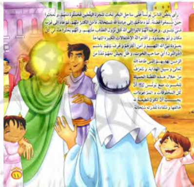
تصویر ۹ رفت و برگشت میان متن و تصویر داستان «الحوت المطیع» (الکندی، ۲۰۰۹: ۱۱)

در داستان «الحوت المطیع» در تصویر صفحه ۱۱ حضرت یونس (ع) در حال گفت‌وگو با مردم است و این تصویر همان وقایع متن را در ذهن کودک بازتابی و تکرار می‌نماید و متوجه می‌شود که حضرت یونس (ع) در حال تعریف ماجرای است که در دریا برایش رخ داده است و این تکرار و دوباره‌سازی ماجرا به خواننده کودک امکان می‌دهد رویدادها را بار دیگر از زبان حضرت یونس (ع) بشنود.