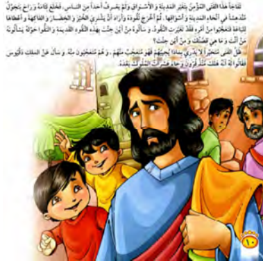
تصویر ۱۶ همانندی میان متن و تصویر داستان «الکلب الحارس» (الکندی، ۲۰۰۹: ۱۰)