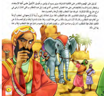
تصویر ۱۱ پیش‌آگاهی متن و تصویر داستان «أباييل السماء» (الکندی، ۲۰۰۹: ۹)

در داستان «البقرة النادرة» در صفحه ۱۰ عدم رضایت از فروش گاو در چهره صاحب گاو پیداست و گاو نیز به دلیل خواسته کافران از صاحبش چهره‌ای نگران دارد. در گوشه بالای تصویر هم کیسه‌ای پر از سکه طلا نقش بسته است و گویا هر چند صاحب گاو از فروش گاو ناخرسند است، اما به فکر پول و درآمد است. پس در واقع این سکه‌ها از فروش گاو در آینده خبر می‌دهد.