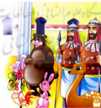
تصویر ۱۵ همانندی میان متن و تصویر داستان «الهدهد والخبر اليقين» (الکندی، ۲۰۰۹: ۶)

مجموعه داستانی قصص الحيوانات روایت‌کننده بخش‌هایی از قرآن است. بین تمامی داستان‌های این مجموعه ارتباطی منظم و منطقی وجود دارد و طرح لباس و شکل و رنگ شخصیت‌های داستانی در سراسر آن بسیار شبیه به هم است؛ به گونه‌ای که قهرمانان و شخصیت‌هایی که در هر داستان حضور دارند، از نظر چهره، رنگ مو، حجم، شکل و بلندی مو، نوع پوشش از قبیل ردا، بالاپوش و دستار تفاوت چندانی با هم ندارند. پس مخاطب کودک در سراسر این سلسله مجموعه با نوعی تمرکززدایی همه جانبه و پی‌درپی روبه‌روست. تصویرگر در هر داستان نیز به‌طور جداگانه در ترسیم لباس، چهره و مو به شبیه‌سازی دست زده است تا آن‌جا که شخصیت‌های گوناگون با اعمال و رفتارهای یکسان به یک شکل جلوه‌گری می‌کنند؛ به عنوان نمونه شکل و ظاهر سربازها در داستان‌های «الهدهد والخبر اليقين»، «الطائر الترابي» و «أبایيل السماء» شباهت‌هایی با هم دارند؛ یک نوع کلاه به سر دارند و لباسشان یکسان طراحی و تزئین شده است. همچنین در داستان «الكلب الحارس» چهره دو کودک عیناً شبیه هم طراحی شده است.