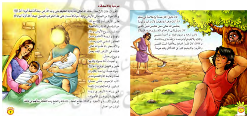
تصویر ۳ رابطه مکملی میان متن و تصویر داستان «الغراب الذكي»

رابطه مکملی در نمونه‌های ذکرشده همگی از نوع رابطه‌ای است که تصویر مطالبی را که متن از عهده بیان آن بر نمی‌آید، تکمیل می‌کند. اما همان‌طور که بیان شد، دیگر رابطه مکملی، رابطه‌ای است که متن مطالبی را بیان می‌کند که تصویرگر از عهده آن بر نمی‌آید. نمونه این رابطه در صفحه ۴ و ۵ داستان «البقرة النادرة» دیده می‌شود. داستان در متن این دو صفحه این‌گونه است که روزی بنی اسرائیل با جسد تاجری روبه‌رو می‌شوند که نزدیک خانه‌اش افتاده است. آنها با ناراحتی دور جسد حلقه می‌زنند. در این مورد، تصویرگر نتوانسته است به خوبی متن را نشان دهد.