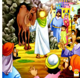
تصویر ۴ رابطه تقابلی رنگ و شخصیت پردازی میان متن و تصویر داستان «الناقة المعجزة» (الکندی، ۲۰۰۹: ۶)