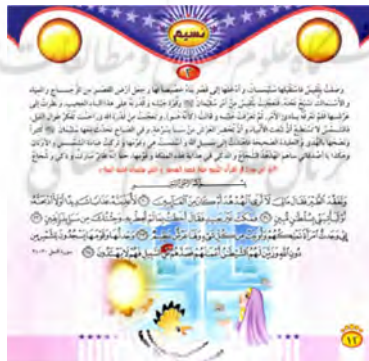
تصویر ۱۳ تغییر پس‌زمینه میان متن و تصویر داستان «الهدهد والخبر اليقين» (الکندی، ۲۰۰۹: ۱۲)

این شگرد در داستان «الهدهد والخبر اليقين» دیده می‌شود که در صفحه ۱۲ با بازی رنگ‌ها ایجاد شده است. رنگ آبی روشن حالتی نورانی و ملکوتی به فضای قصر شیشه‌ای بخشیده است و رنگ‌های سفید، صورتی روشن و طلایی این آرامش را دو چندان کرده است و عالمی روحانی را سبب شده است. این درحالی است که در صفحه‌های قبل تصویرها رنگ‌هایی تیره و تند دارند.