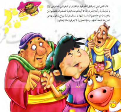
تصویر ۱۲ پیش‌آگاهی متن و تصویر داستان «البقرة النادرة» (الکندی، ۲۰۰۹: ۱۰)