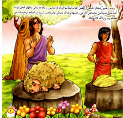
تصویر ۱ رابطه قرینه‌ای میان متن و تصویر داستان «الغراب الذکی» (الکندي، ۲۰۰۹: ۹)