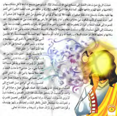
تصویر ۲ رابطه قرینه‌ای میان متن و تصویر داستان «ملکه التمل» (الکندي، ۲۰۰۹: ۸)