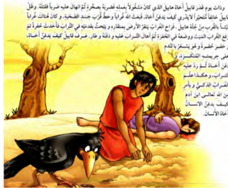
تصویر ۸ سپیدنویسی میان متن و تصویر داستان «الغراب الذکی» (الکندی، ۲۰۰۹: ۱۱)