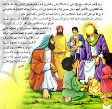
تصویر ۱۴ همین و همان میان متن و تصویر داستان «الطائر الترابی» (الکندی، ۲۰۰۹: ۶-۷)