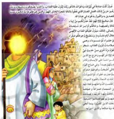
تصویر ۱۰ تعادل و ناتعادلی میان متن و تصویر داستان «الناقة المعجزة» (الکندی، ۲۰۰۹: ۱۱)

تصویر کشیدن ساحلی آرام و حضرت یونس (ع) که در کنار ساحل لم داده است، بار دیگر تعادل به داستان باز می‌گردد. در داستان «الناقة المعجزة» هم در صفحه ۱۱ نازل شدن عذاب بر کافران با به تصویر کشیدن خانه‌ها با خط‌های کج و معوج و آسمانی بی‌قرار در معرض دیدگان کودک قرار می‌گیرد.