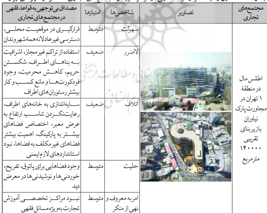
جدول ۵. مصادیق رعایت نکردن قواعد فقهی در مراکز خرید و مجتمع‌های تجاری معاصر در شهرهای ایران

توجه به گزارش وزارت صنعت، به طور میانگین در دنیا به ازای هر ۱۰۰ خانواده یک واحد صنفی وجود دارد، اما در ایران به ازای هر ۲۵ تا ۲۸ خانواده یک واحد صنفی است که اقتصاد ایران کشش این حجم از مراکز خرید را ندارد؛ یعنی در ایران تقریباً چهار برابر میانگین جهانی فروشگاه و مغازه وجود دارد. در چند سال اخیر نیز شاهد تغییر ماهیت تجاری فضاهای خرید و فروش و پاساژها از کاربرد صرفاً تجاری به تجاری- تفریحی و ایجاد فضاهایی برای اوقات فراغت و تفریح در این گونه فضاها به شکل امروزی بودیم. از آنجا که یکی از کارهای ضروری که باید درباره معماری و شهرسازی اسلامی صورت گیرد، تطابق مقررات و ضوابط جاری با دستورات فقهی است، به منظور انطباق مقررات و ضوابط جاری در مراکز خرید و مجتمع‌های تجاری با دستورات فقهی ابتدا به بررسی وضعیت مراکز خرید و مجتمع‌های تجاری در کلان‌شهرهای ایران از طریق پرسشنامه تدوین شده براساس شاخص‌ها و مصاحبه‌های صورت گرفته با مراجعان پرداخته شد. سپس براساس جدول ۵، امتیازبندی‌ها صورت گرفت و نمونه مصادیقی از تعارض با شاخص‌های ارائه شده در نمونه‌های موردی منتخب بیان شده و در نهایت اثرات و نتایج رعایت نکردن آن‌ها ارائه شد.