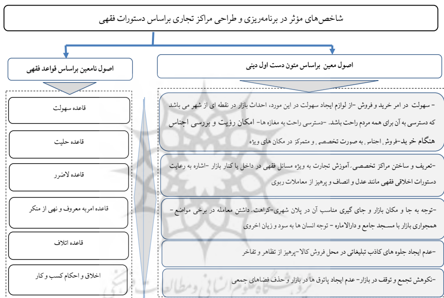
شکل ۲. مدل مفهومی پژوهش

اگر بتوانیم مسکن را تعمیم دهیم و معیار وَاجْعَلُوا بُيُوتَكُمْ قِبْلَةً (یونس: ۸۷) شامل بازار هم بشود، شیوه ساخت بازار اسلامی مطابق با ساخت مسکن قرآنی است. وقتی مغازه‌های بازار روبه‌روی یکدیگر باشند، فعالیت‌ها در ملاء عام صورت می‌گیرد و زمینه‌ای برای کار خلاف فراهم نمی‌شود. ثمره این ویژگی، کسب لقمه حلال است. بازار اسلامی بر محور مسجد بنا شده است. وجود مدارس علمیه در این بازار نیز موجب شده است فریاد رسای «الفقه ثم المتجر» در این بازار طنین‌انداز شود و روحانیت از تطابق بازار و رفتار بازاریان با شرع و اخلاق مراقبت کند (رجایی، ۱۳۸۹، ص ۱۰۵).