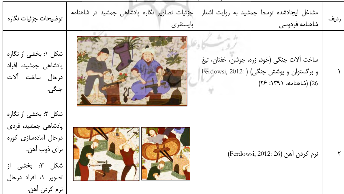
Table 1. Classification of industries and occupations in the painting of Jamshid Kingdom (Baysonqor's Shahnameh) based on the poems of Shahnameh. (Authors)

جدول ۱. طبقه بندی صناعات و مشاغل در نگاره پادشاهی جمشید (شاهنامه بایسنقری) براساس اشعار شاهنامه. (نگارندگان)