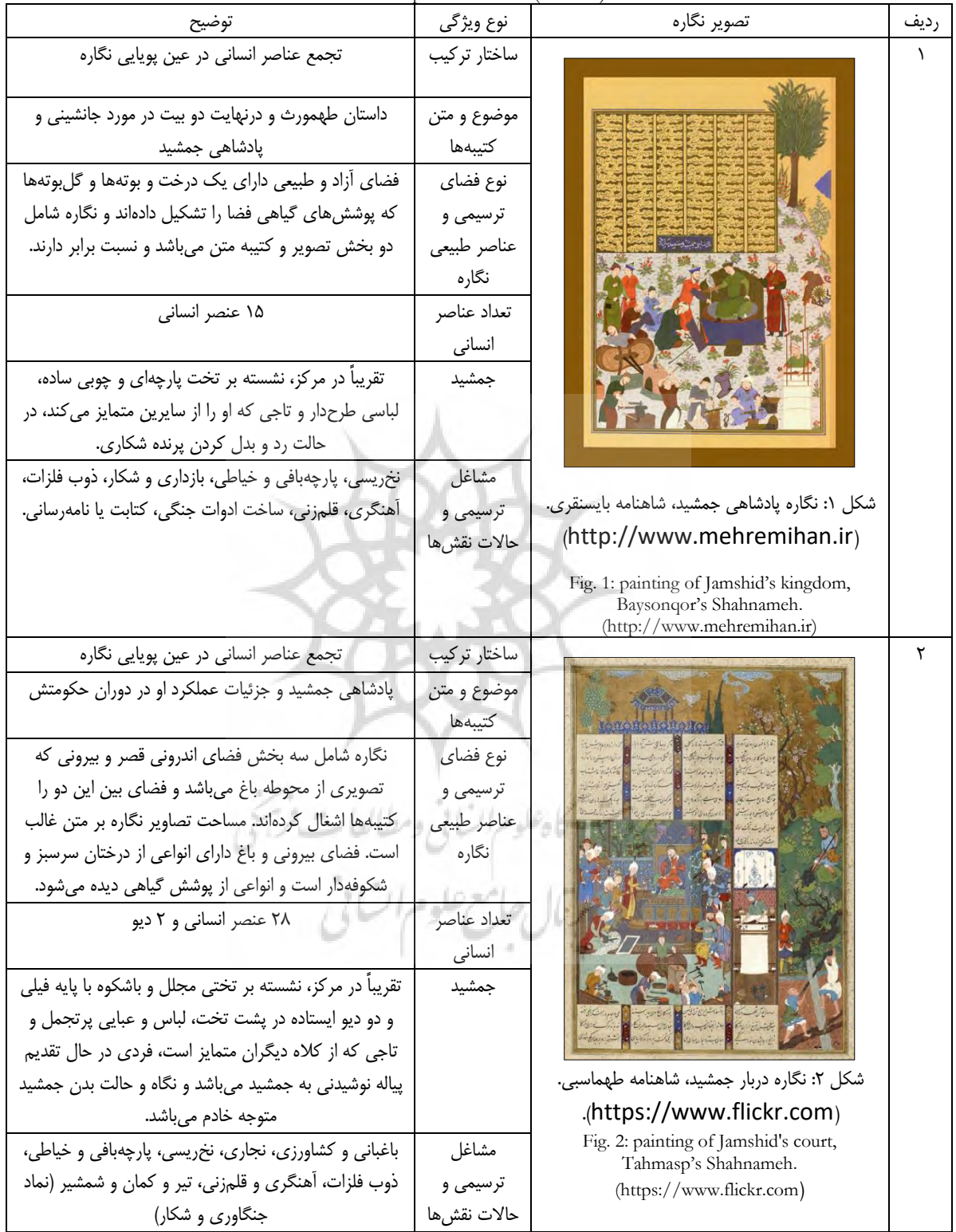
جدول ۴. تحلیل و تطبیق نگاره پادشاهی جمشید در شاهنامه بایسنقری و دربار جمشید در شاهنامه طهماسبی. (نگارندگان). Table 4. Analysis and comparison of the painting of Jamshid's kingdom in Baysonqor's Shahnameh and Jamshid's court in Tahmasp's Shahnameh. (Authors)

با توجه به اطلاعات جدول ۴، به نظر می‌رسد نگاره شاهنامه طهماسبی بیان تصویری دقیق‌تری از حکومت جمشید را ارائه می‌دهد؛ چنان‌که تسخیر دیوان، ساخت کاخ و عمران و آبادسازی ایران در نگاره بایسنقری دیده نمی‌شود. هم‌چنین تجمل و آرایش و اغراق شایسته نیز در بیان تصویری نگاره شاهنامه طهماسبی نسبت به نگاره بایسنقری بیشتر است و همین نکته قدرت شاهانه جمشید را برای