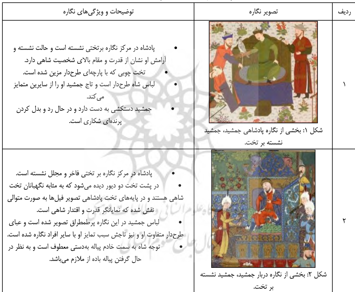
Table 3. comparison of Jamshid's character in two paintings of Jamshid's kingdom and court in the Baysonqor's Shahnameh and Tahmasp's Shahnameh. (Authors)

تصویرنگاری بایسنقری و مطالعه هنری به خلق آثار خود پرداخته‌اند. تفاوتی که در دو نگاره مشاهده می‌شود بازنمایی شغل باغبانی و کشاورزی و چوب‌بری یا نجاری در شاهنامه طهماسبی است که در بایسنقری دیده نمی‌شود. هم‌چنین در شاهنامه بایسنقری هم فردی کیف به کمر دیده می‌شود که مشابه نقش آن در نگاره طهماسبی وجود ندارد. هم‌چنین در نگاره بایسنقری نقش پرنده شکاری به رسم شکار اشاره دارد که در نگاره طهماسبی افرادی دیده می‌شوند که تیر و کمان و شمشیر به دست دارند و این لوازم هم بر امر شکار و هم بر قدرت جنگاوری اشاره دارد. مقایسه جزئیات مشاغل و صناعات در دو