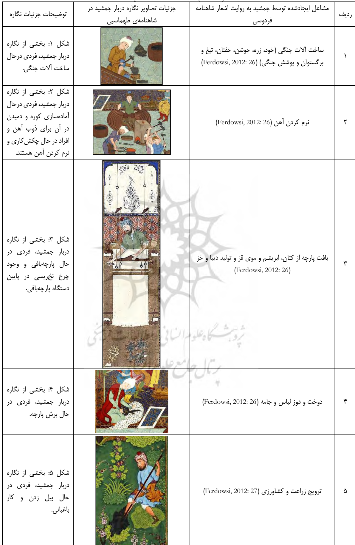
جدول ۲. طبقه‌بندی صناعات و مشاغل در نگاره دربار جمشید (شاهنامه طهماسبی) براساس اشعار شاهنامه. (نگارندگان) Table 2. Classification of industries and occupations in the painting of Jamshid Kingdom (Tahmasp's Shahnameh) based on the poems of Shahnameh. (Authors)