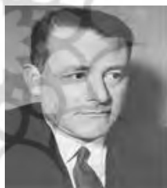
شکل ۱: کارل اشمیت

و تا آخر عمر نیز که در سال ۱۹۸۵ درگذشت، در انزوا زیست (Dyzenhaus, 1997). اما آنچه که باعث شد تا کارل اشمیت نیمه دوم و اوایل قرن بیست و یکم مجدداً برجسته شود و در آثار اندیشمندان بزرگی هم‌چون هانا آرنت و جورجواگامین مورد بحث قرار گیرد، اساساً وضعیت سرمایه‌داری معاصر و یا نئولیبرالیسم که بحران‌های اجتماعی و سیاسی گسترده‌ای را در جامعه جهانی خلق کرده است از این روجغرافیدانان سیاسی برجسته‌ای چون کلودیو مینکا و