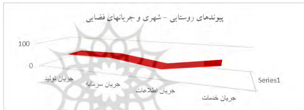
شکل ۳. شدت ارتباطات روستایی-شهری و جریان های فضایی در ناحیه دالاهو

این گونه که نمودار بالا نشان می دهد بیشترین شدت جریان مربوط به جریان خدمات با میانگین ۵۵ و جریان سرمایه با میانگین ۴۸/۷ و جریان تولید با میانگین ۴۷/۸ بوده است و کمترین شدن جریان مربوط به جریان اطلاعات و ارتباطات با میانگین ۲۰ می باشد که ناشی از محدودیت طبیعی-اکولوژی، ضعف زیرساختهای ارتباطی بوده است.