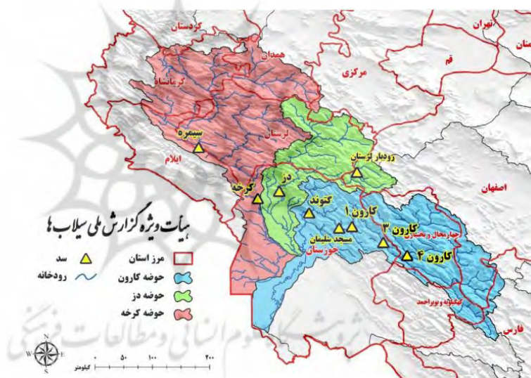
شکل ۳: شبکه رودخانه‌های حوضه آبریز کرخه، دز و کارون و سدهای مربوط به آنها

زیرحوضه دز: رودخانه دز از مهم‌ترین شاخه‌های رودخانه کارون بزرگ است و آبهای مناطق وسیعی از شهرستان‌های الیگودرز، بروجرد و خرم‌آباد از استان لرستان، فریدون‌شهر از استان اصفهان و دزفول از استان خوزستان را جمع‌آوری می‌کند. این رودخانه پس از سد مخزنی دز و سد تنظیمی دزفول و گذر از میانه شهر دزفول در محلی به نام بندقیر به رودخانه کارون ملحق می‌شود.