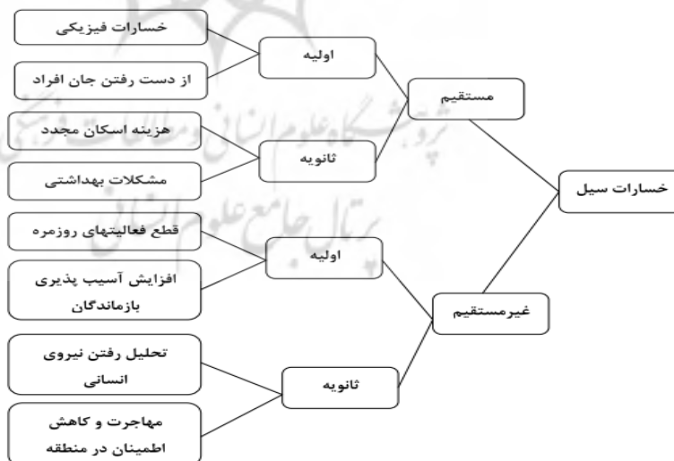
شکل ۱: نمودار خسارات سیل (Smith & Ward, 1998)

در شکل ۱ دسته بندی خسارات عمومی سیل به صورت کلی آورده شده است.