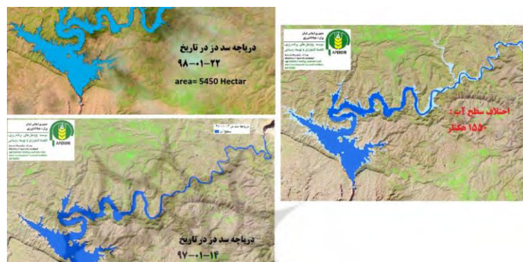
شکل ۴: مقایسه سطح آب دز در سال ۱۳۹۸ و ۱۳۹۷ (اللهی، ۱۳۹۸)