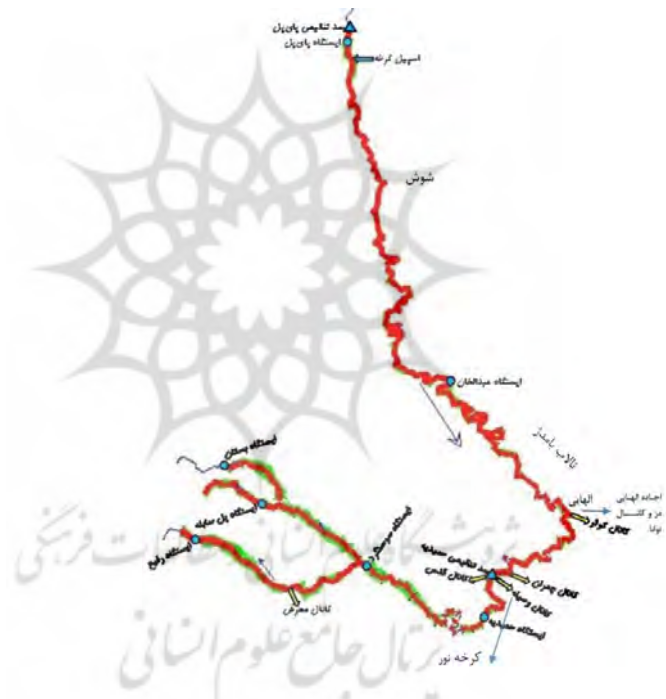
شکل ۲: رودخانه های اصلی حوضه آبریز کرخه در پایین دست سد کرخه

حوضه آبریز کرخه: رودخانه کرخه پس از خروج از ارتفاعات زاگرس وارد خوزستان می شود و پس از سد مخزنی کرخه از باختر دزفول و از شهرهای شوش، عبدالخان، حمیدیه، سوسنگرد و بستان عبور می کند. رودخانه کرخه در منطقه سوسنگرد به دو شاخه هوفل و نیسان تقسیم شده و در نهایت وارد باتلاق های هورالهوریزه یا همان هورالعظیم می شود. در شکل ۲ شبکه رودخانه ای حوضه آبریز کرخه نشان داده شده است.