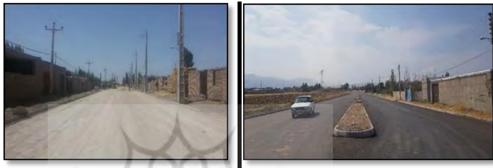
شکل ۳: تحولات فضایی ناشی از اجرای طرح هادی

همگام با تحولات اجتماعی- اقتصادی و گسترش فناوریهای گوناگون، از یکسو و فشردگی هرچه بیشتر تعامل روستایی- شهری و تغییر رفتار اجتماعی- اقتصادی روستائیان، کاربریهای روستایی نیز دستخوش دگرگونی می‌گردد. این روند دگرگونی، به نوبه خود، ساختار عمومی بافت روستا را دستخوش تحول می‌سازد (ضمنا نک: سرتیپی پور، ۱۳۸۸، ۵۵). تغییرات کاربری اراضی در روستاها عموماً شامل روند تغییر کاربری اراضی کشاورزی به نفع دیگر کاربریها (مسکونی و کارگاهی) است. این تغییرات قاعدتاً متأثر از نیروها و عوامل درونی و عوامل و نیروهای بیرونی، تحت تاثیر روابط روستایی- شهری، حادث می‌شوند (سعیدی و همکاران، ۱۳۹۵: ۲۸). گاهی بنظر می‌آید، این عوامل و نیروها به تنهایی در تعیین نوع کاربری و نهایتاً بافت دخالت دارند، اما بایست توجه داشت که اثرگذاری عوامل و نیروها در اغلب موارد بصورتی ترکیبی و هم‌افزا اتفاق می‌افتد. از این رو، بررسی تجربیدی آنها و منحصرکردن "فردی" این نیروها و عوامل در برپایی کاربریها و بافت، نادرست و غیرعلمی است. در اینجا، این عوامل، خلاصه‌وار و به شرح زیر، مورد بحث و نتیجه‌گیری قرار می‌گیرند.