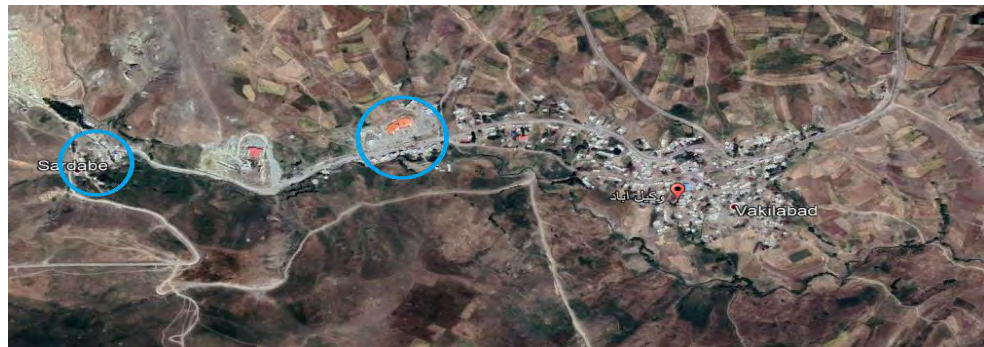
شکل ۵: مکان‌گزینی کاربریها در ارتباط با چشمه (روستای وکیل آباد)