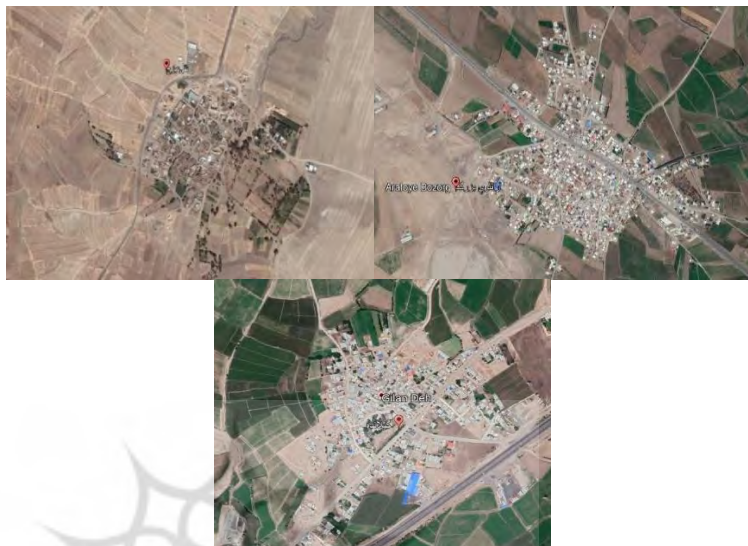
شکل ۴: بافت فشرده روستاها بر اثر اقلیم سرد

موقعیت، ارتفاع، دوری و نزدیکی به دریا و نیز عناصر اقلیمی، همچون رطوبت، بارش، گرما و زاویه تابش، مد نظر قرار می‌گیرند. در ناحیه مورد بررسی، بافتهای فشرده را اغلب به سبب استقرار در اقلیم سرد و کوهستانی بشمار آورده‌اند، حال آنکه ممکن است عواملی دیگر، مثلاً منبع تامین آب (قنات) یا عنصری ارزشمند بلحاظ مذهبی (امامزاده)، به کمک عوامل دیگر زمینه‌ساز آن بوده باشد (سعیدی، ۱۳۸۸، ۵۳-۵۴). هرچند این نیز واقعیت دارد که در اغلب روستاهای ناحیه، بویژه روستاهای دامنه‌ای و کوهستانی، فشردگی بافت به سبب اقلیم سرد و پیشگیری از اتلاف انرژی است.