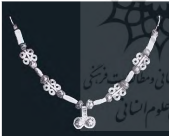
تصویر ۲. گردنبند طلا، منطقه حسنلو، سده‌های هشتم و نهم پ.م، موزه ایران باستان، تهران (نگارندگان). (ضیاءپور، ۱۳۴۴: ۹۰).