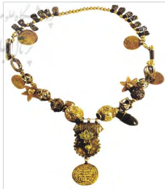
تصویر ۷. گردنبندها طلا، گرگان، سده چهارم ه. ق.، طول ۳۵ سانتی‌متر