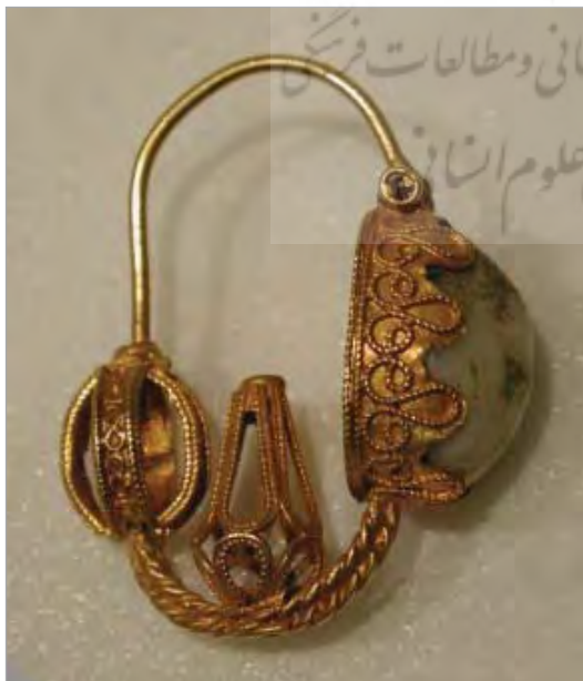
تصویر ۸. گوشواره طلا، دوران سلجوقیان، گرگان

از میان زیورآلات فراوانی که از این دوره به‌دست آمده گوشواره‌های بسیار جالب از جنس طلا و متعلق به منطقه گرگان، بیش از همه در بردارنده ویژگی‌های هنر ملیله‌سازی، استفاده از نوار تابیده، پیچک‌گذاری و لحیم‌کاری پودری، است (تصویر ۸).