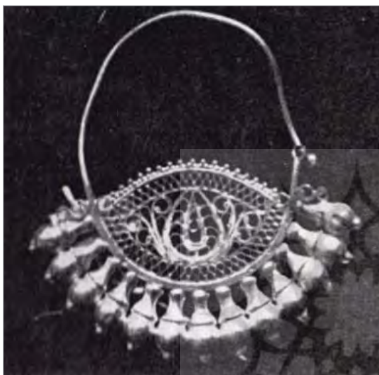
تصویر ۱۱. گوشواره طلا، دارای آویزهای کوزه ای شکل ثابت و دیواره ماشین ملیله، سده دوازدهم ه.ق. (ضیاءپور، ۱۳۴۴: ۳۹۲).

از دیگر سو تفاوت های موجود در این آثار، وزنه پیشرفت را بیشتر به سوی دوره بعد از اسلام می کشاند. دوره ای درخشان از هنر ایران که ریشه در هنر دوره های پیش از خود دارد. در این دوره، لشگرکشی های پیاپی و گسترش مرزهای ایران باستان، توسعه بازرگانی، اوضاع مساعد اقتصادی و حمایت شاهان و درباریان از جامعه هنری، تبادل هنری را برای هنرمندان ایران زمین مهمی ساخت و سبب رونق کسب و کار آنها می شد. بی دلیل نیست که در همین دوران، پیشرفت در هنر ملیله سازی دیده می شود. برگ فرنگ (پیچک یک چشم)، بادامچه، ریز جقه، برگ، بقچه، پیچک دو چشم و سه چشم که با نوار ملیله (مفتول تابیده و نورده شده) ساخته می شدند؛ به سازنده این امکان را دادند که سطحی ظریف و قابل انعطاف بسازد که قابلیت حجم سازی نیز داشته باشد.