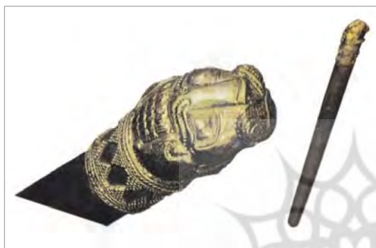
تصویر ۱. دسته سنگ سنباده از جنس طلا، قلاده شیر با تزئینات خوشه‌ای، طول ۰/۱ متر، موزه لوور، پاریس (آمیبه، ۱۳۷۲: ۸۷).

- هخامنشیان: ویژگی هنر زرگری هخامنشی، آمیختن و آشتی دادن میان شیوه‌های متفاوت جواهرسازی در سرزمین‌های تحت سلطه شاهان هخامنشی است. مزیت مهارت فنی، تعادل