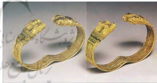
تصویر ۴. یک جفت النگوی طلا با نقش سر شیر، دوران هخامنشی، موزه میهو ژاپن (محمدپناه، ۱۳۸۵: ۱۳۹).

– اشکانیان (پارتیان): با بررسی اندک آثار برجای مانده از تمدن و فرهنگ اشکانی و پیکره‌ها و نقوش برجسته پادشاهان و ملکه‌ها، جنگاوران، شاهزادگان اشکانی در ایران همانند الحضرة، پالمیر ۷ ، نیپور ۸ و دو راروپوس ۹ اینچنین دریافت می‌شود که اشکانیان علاقه بسیاری به جواهرات و اشیای زرین و سیمین داشتند (فخرموحدی، ۱۳۸۷: ۱۶). درباره ملیه‌سازی این عصر نمی‌توان بسیار سخن گفت بلکه تنها با بررسی نمونه‌های موجود، می‌توان به عمده ویژگی‌های شاخص آن پی‌برد. آویز طلا در تصویر ۵ نمونه‌ای است که طراحی ساده و معمول در جواهرسازی پارتی را نمایان می‌سازد.