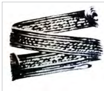
تصویر ۳. انگشت طلا، گیلان، هزاره اول پیش از میلاد (ضیاءپور، ۱۳۴۴: ۵۶).

اسلامی ایران معرفی خواهند شد. این آثار متعلق به تمدن‌ها و سلسله‌های حاکم بر ایران در محدوده زمانی هزاره سوم پیش از میلاد تا دوره قاجار و محدوده مکانی ایران کنونی است.