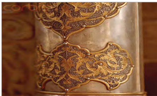
تصویر ۱۰. بخشی از درب ملیله کاری شده، از جنس نقره، دوران صفویان، مدرسه چهارباغ اصفهان (نگارندگان).