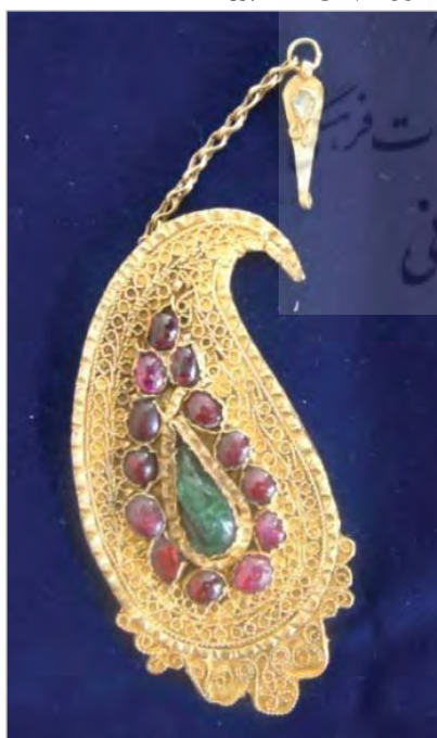
تصویر ۱۲. جقه ملیله طلا، یاقوت نشان، اصفهان، سده سیزدهم ه.ق.، موزه هنرهای تزئینی اصفهان (نگارندگان).