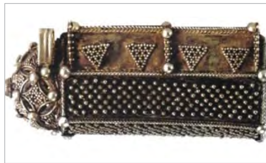
تصویر ۹. جای دعا از جنس طلا و ملیله، مشبک و زبره کاری، اصفهان، سده دهم ه.ق. (فخرموحدی، ۱۳۸۷: ۱۴).