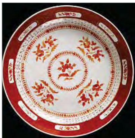
تصویر ۸. چینی ساخت روسیه، موزه ویکتوریا و آلبرت، شماره: c. 25-2004 ( http://v&a museum.collections.vam.ac.uk ).