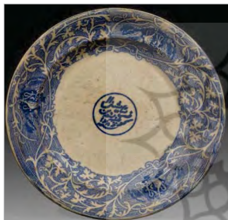
تصویر ۱۰. بشقاب، ساخت به سفارش انگلیس، موزه قاجار تبریز (نگارندگان).