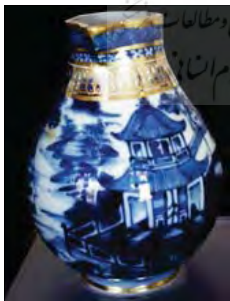
تصویر ۱۱. پارچ، ساخت انگلیسی چین، موزه قاجار تبریز.

مختصری آورده شود. روش تزئین سفالینه‌های سفید-آبی نوعی نقاشی زیرلعاب است که از سده‌های سوم و چهارم ه.ق. آغاز شد. در این گونه نقاشی، ابتدا بدنه سفالی با لایه‌ای از لعاب سفید پوشیده و سپس روی آن با نقوش آبی و لاجوردی و سیاه نقاشی می‌شد. رنگ آبی برای سطوح و رنگ سیاه برای دورگیری و پرداختن به جزئیات کاربرد داشت. در نهایت با لعابی شفاف و شیشه‌ای، روی آن پوشانده می‌شد. اوج اعتلای تکنیک ساخت و تنوع طرح سفال سفید-آبی را می‌بایست در دوره صفوی جستجو کرد.