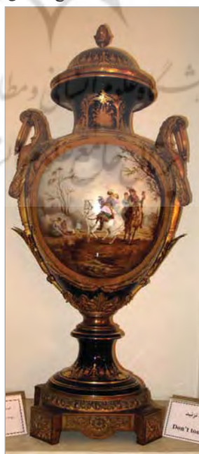
تصویر ۵. کاپ تزئینی اروپایی، هدیه شاهان فرانسه به شاهان قاجار، موزه کاخ گلستان (نگارندگان).