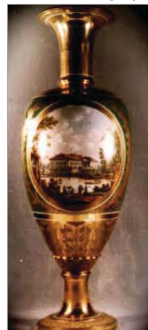
تصویر ۶. گلدان، احتمالاً ساخت روسیه، موزه کاخ گلستان.