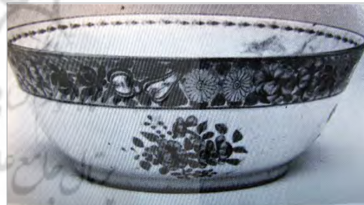
تصویر ۱۶. نمونه‌ای از ظروف مینایی ساخت چین، موزه توپقایی سرای (Krahl, 2000:75).

( http://v&a-museum.collections.vam.ac.uk ).