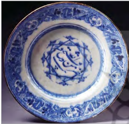
تصویر ۱۴. موزه ویکتوریا و آلبرت، شماره: 1018-1876

( http://v&a museum.collections.vam.ac.uk ).