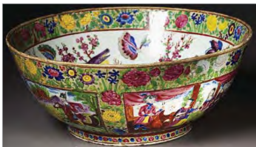
تصویر ۱۹. کاسه چینی مینایی، ساخت ایران، موزه بروکلین، شماره: 74.102.3 ( http://www.brooklynmuseum.org )