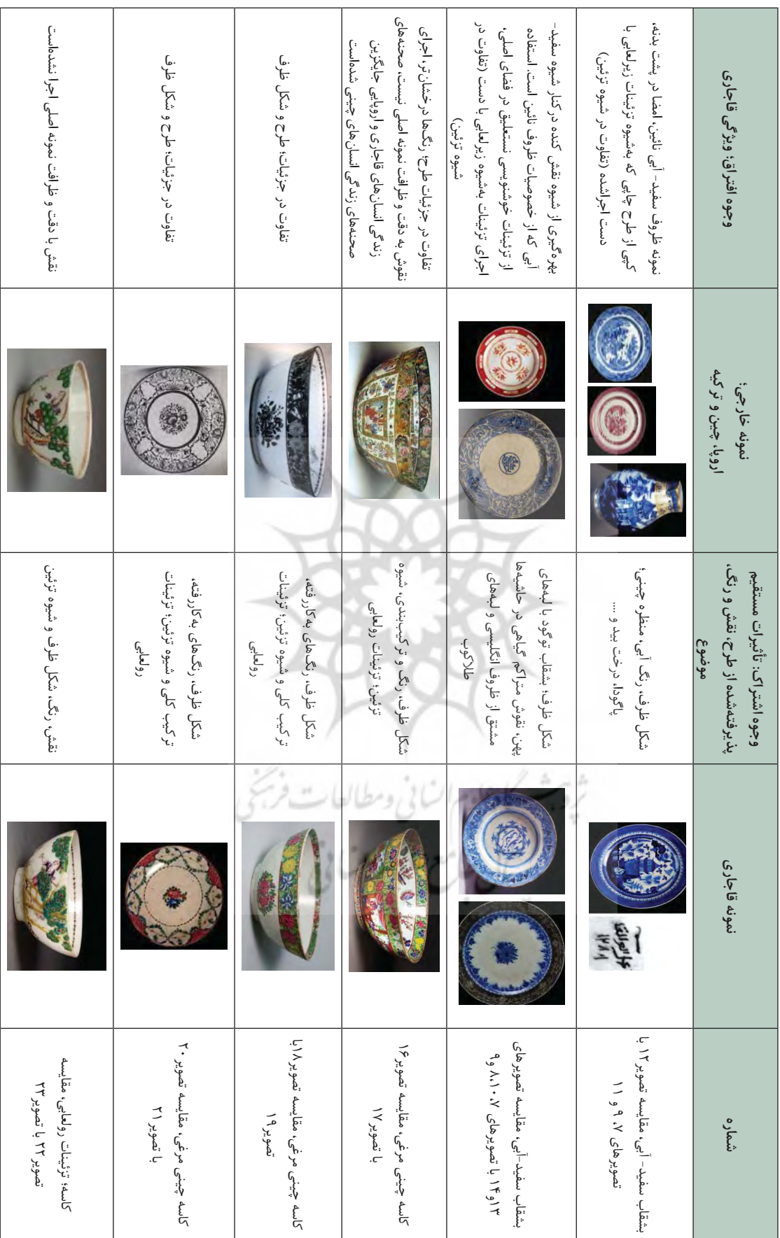
جدول ۱. جدول تطبیقی ظروف سفالی و سرامیکی داخلی و نمونه‌های وارداتی در دوره قاجار