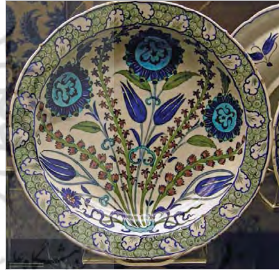
تصویر ۲۶. بشقاب، ساخت ایران، موزه بریتیش، شماره: ME G 1983.49