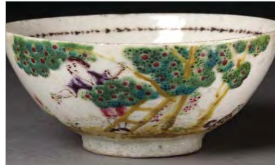
تصویر ۲۲. کاسه، ساخت ایران، موزه ویکتوریا و آلبرت، شماره: 980-1876 ( http://v&a museum.collections.vam.ac.uk ).