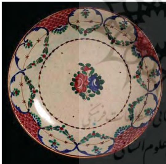
تصویر ۲۱. کاسه چینی مینایی، ساخت ایران، موزه ویکتوریا و آلبرت، شماره: HMC.339 ( http://v&a museum.collections.vam.ac.uk ).

در همین دوران بود که آثار سفالین سده شانزدهم میلادی ایزنیک برای نخستین بار توجه اروپائیان را به خود جلب کرد