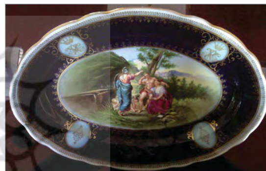
تصویر ۳. بشقاب کوچک، احتمالاً ساخت روسیه، موزه مردم‌شناسی کاخ گلستان (نگارندگان).