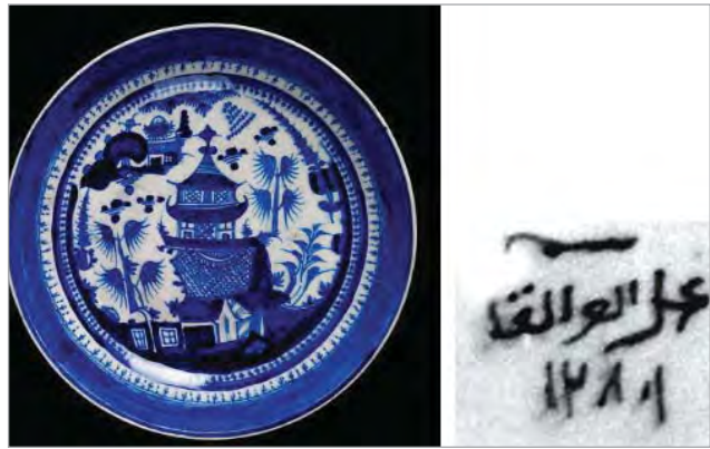
تصویر ۱۲. بشقاب سفید- آبی، موزه ویکتوریا و آلبرت، شماره: 545-1888 ( http://v&a museum.collections.vam.ac.uk ).