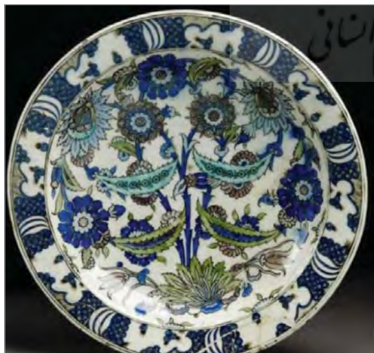
تصویر ۲۵. بشقاب، ساخت ایران، موزه اشمولن آکسفورد، شماره: EA. 1978.1483 ( http://v&a.museum.collections.vam.ac.uk ).