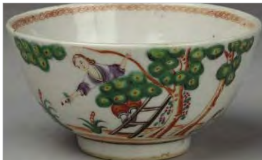
تصویر ۲۳. کاسه، ساخت چین، یافت شده در ایران، موزه ویکتوریا و آلبرت، شماره: 531-1888 ( http://v&a museum.collections.vam.ac.uk ).