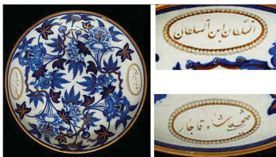
تصویر ۱. موزه ویکتوریا و آلبرت، شماره: C.29-1984 ( http://v&a.museum.collections.vam.ac.uk ).

این اتفاق، یکی از دلایل نزول صنعت سفالگری در دوره قاجار است. در تصویر ۱، نمونه‌ای از ظروف ساخت کارخانه وچوود انگلیس به سفارش فتحعلی‌شاه و در تصویرهای ۲-۶، نمونه‌هایی از ظروف وارداتی ساخت روسیه، انگلیس و فرانسه دیده می‌شود.