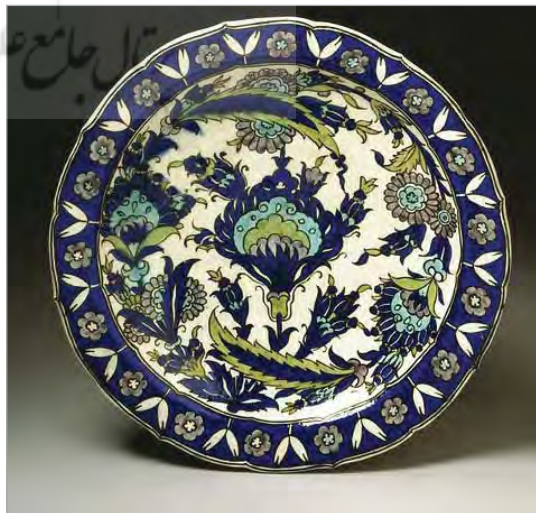
تصویر ۲۶. بشقاب، ساخت ایران، موزه ویکتوریا و آلبرت لندن، شماره: 125-1899 ( http://v&a.museum.collections.vam.ac.uk ).