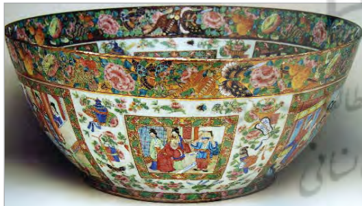
تصویر ۱۷. سفالینه مینایی، ساخت ایران، موزه ویکتوریا و آلبرت شماره: 1878-632

این نوع ظروف وارداتی از چین، نقوش رنگارنگ گل و مرغ، پروانه و صحنه‌هایی از زندگی انسان‌های چینی است (تصویرهای ۱۵ و ۱۶) که به دلیل استقبال عموم، سفالگران ایرانی عیناً از آنها تقلید می‌کردند. لیکن به تدریج صحنه‌هایی از زندگی انسان‌های ایرانی با لباس‌های قاجاری و مناظر ایرانی و اروپایی معمولاً درباریان، جایگزین مناظر و پیکره‌های چینی در این ظروف شدند (تصویر ۱۷). در میان این نوع چینی‌آلاتی که به ایران وارد شده بود، نمونه‌هایی دارای نوشته نیز همچون چند بشقاب متعلق به فتحعلی‌شاه و ظروفی که از آن مسعود میرزا ظل‌السلطان، پسر بزرگ ناصرالدین شاه و والی فارس بود، وجود داشت. این ظروف به سفارش شاهان، شاهزادگان، مقامات دولتی، تاجران و اشراف ساخته می‌شد و معمولاً در کتیبه‌ای روی ظرف، تاریخ و نام سفارش‌دهنده یا ابیاتی از اشعار معروف به خط ثلث یا نستعلیق نوشته می‌شد (تصویر ۱۵). تصویر ۲۲، نمونه‌ای دیگر از ظروف با تزیینات رولعایی قاجار را نشان می‌دهد که برگردان کاملی از نمونه‌های صادراتی اروپا با نقشی معروف به گیلان چین "the Cherry Pickers" است. براساس طرحی از نقاش فرانسوی بادوین/آنتوین ۳۲ ، به نظر می‌رسد سفالگر ایرانی براساس نمونه اصلی که در اختیار داشته این ظرف را ساخته‌است (تصویر ۲۳). طرح روی این ظرف نخست از اروپا برای صادرات به چین فرستاده شد و دوباره سفالگران چینی آن را به منظور صادرات، به اروپا برگرداندند. در این