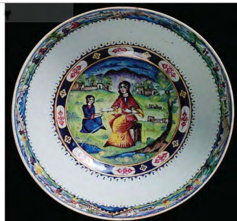
تصویر ۲۸. کاسه سفالینه چندرنگ polychrom، موزه ویکتوریا و آلبرت شماره: 468-1878 ( http://v&a_museum.collections.vam.ac.uk ).