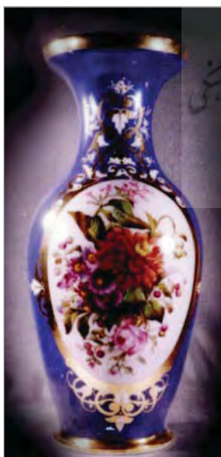
تصویر ۴. گلدان، ساخت فرانسه، آرشیو موزه کاخ گلستان.