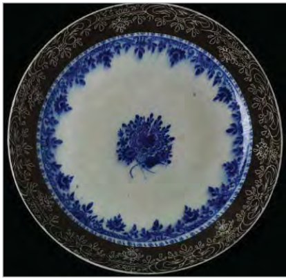
تصویر ۱۳. سفالینه سفید- آبی، موزه ویکتوریا و آلبرت، شماره: 868-1786 ( http://v&a museum.collections.vam.ac.uk ).