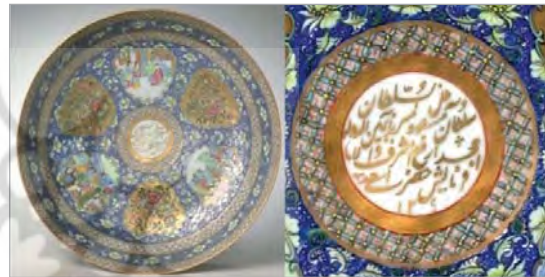
تصویر ۱۵. بشقاب بزرگ، ساخت چین (چینی مینایی)، شماره: ۱۹۹۹۰۴۰، سان فرانسیسکو، در کتیبه نوشته‌شده: فرمایش حضرت اشرف اسعد ارفع امجد والا مسعود میرزایمین الدوله ظل السلطان ۱۲۰۹ ه.ق. ( http://www.asianart.org )

تصویرهای ۱۶، ۲۰، ۱۸ و ۲۲، نمونه‌هایی از چینی‌های مینایی ساخت چین هستند که برای بازارهای شرق میانه تولید می‌شدند. تصویرهای ۱۵، ۱۷، ۱۹، ۲۱ و ۲۳ نیز ظروفی هستند که در ایران شبیه‌سازی شده‌اند و شباهت‌های آشکاری با نمونه‌های چینی در رنگ، طرح و نقش دارند. طرح عمده