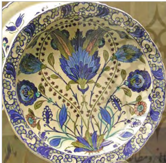
تصویر ۲۷. بشقاب، ساخت ایران، موزه بریتیش، شماره: ME G 1983.21

می‌توان گفت تأثیرات غیرمستقیم ظروف سرامیکی خارجی بر نمونه‌های قاجاری، بازتابی از تأثیرات پذیرفته‌شده نقاشی قاجاری از اصول نقاشی اروپایی در این دوره است که در این ظروف نمایان شده‌است. این تأثیرات در مواردی چون برهنه‌گرایی در پوشش بانوان، بهره‌گیری از اصول سه بعدنمایی و چشم‌اندازها و صحنه‌های زندگی انسان‌های اروپایی در ترکیب با نقاشی ایرانی کاملاً ملموس است (تصویرهای ۲۸، ۳۳ و ۳۴). همچنین در تصویرهای ۶-۲، نمونه‌هایی از چشم‌اندازهای اروپایی روی ظروف وارداتی دیده می‌شود که نمایانگر این تأثیرات غیرمستقیم است. در انواع سفالینه‌های این دوره نظیر سفالینه‌های چندرنگ قاجاری و سفالینه‌های سفید-آبی این موارد قابل مشاهده است. آنچه پس از این آورده می‌شود، معرفی چند نمونه از این ظروف است.