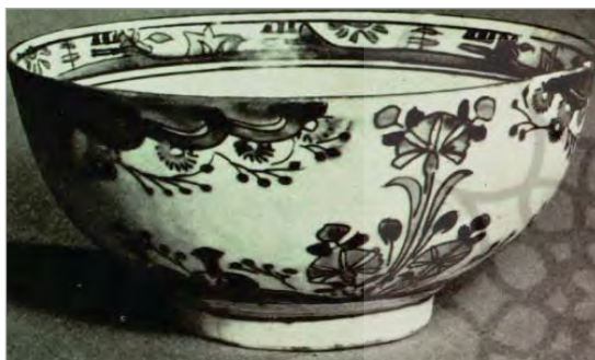
تصویر ۳۰. کاسه (lane, 1957:190).