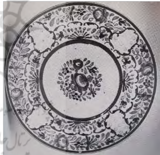
تصویر ۲۰. کاسه، ساخت ایران، موزه ویکتوریا و آلبرت، شماره: 980-1876 ( http://v&a museum.collections.vam.ac.uk ).