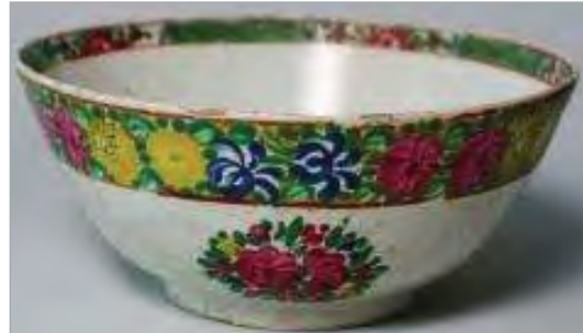
تصویر ۱۸. کاسه چینی مینایی، ساخت چین، موزه توپقایی سرای ترکیه (Krahl, 2000:75).