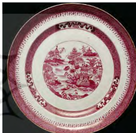
تصویر ۹. بشقاب، ساخت چین، موزه ویکتوریا و آلبرت، شماره: 545-1888 ( http://v&a museum.collections.vam.ac.uk ).