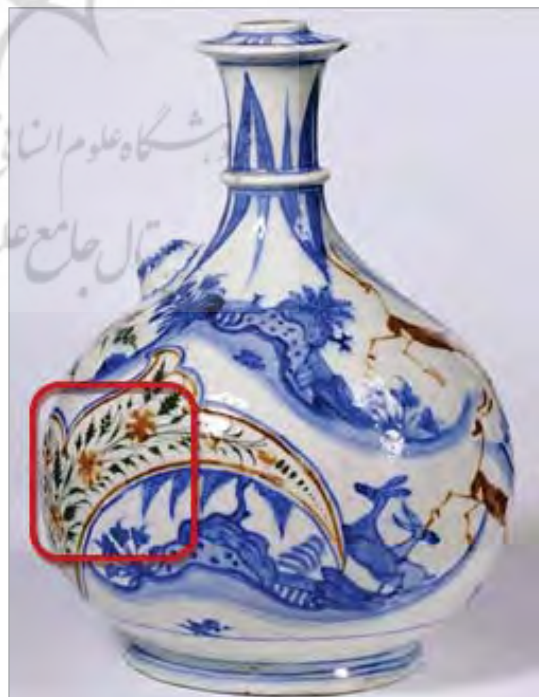
تصویر ۳۱. کوزه قلیان، سده شانزدهم میلادی، موزه اشمولین، شماره: EA1978.1712

در تصویر ۳۳، گلدانی از سفالینه‌های سفید-آبی دوره قاجار دیده می‌شود که بر سطح آن در سه وجه تصویرهایی از زندگی انسان‌ها با جامه‌های اروپایی به رنگ آبی کبالت روی زمینه سفید تصویر شده است. این پیکره‌ها از لحاظ ظاهری بسیار به هم مشابه‌اند و بجز آرایش مو و کلاه حتی در لباس و پوشش نیز تفاوت چندانی باهم ندارند. به نظر نمی‌رسد که بین این صحنه‌ها ارتباط موضوعی وجود داشته باشد و هدف از نقاشی آنها تنها تصویر کردن صحنه‌هایی از زندگی روزمره انسان‌های غربی بوده است. انتخاب چنین صحنه‌هایی با حضور انسان‌های غربی نظریه وضعیت سیاسی و فرهنگی ایران در دوره قاجار و ورود اروپائیان به این سرزمین، پدیده نوظهوری را نشان می‌دهد که در زندگی روزمره مردم احساس و ملموس شده است.