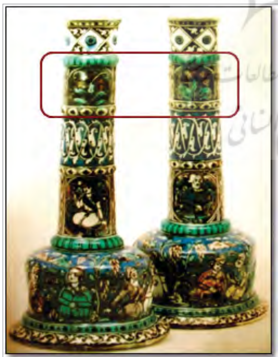
تصویر ۳۲. شمعدان، سده نوزدهم میلادی، مجموعه خلیلی، شماره: Pot 1536A pot 1536 B، نقش میخک قرمز بر گردن ظرف (ورنویت، ۱۳۸۳: ۱۶۳).

تصویر ۲۹ اقتباس شده است که در ترکیب با طرح‌های ایرانی نیز دیده می‌شود. اقتباس چنین نقش‌مایه‌هایی در پی کپی‌های صرف از ظروف ایزنیک که پیش‌تر درباره آنها سخن رانده شد، بدیهی به نظر می‌رسد و دور از ذهن نیست که این نقش‌مایه‌ها در ذهن سفالگران باقی مانده و روی نمونه‌های داخلی ظاهر شده باشند. چنانکه نقوشی چون گل‌های میخک قرمز در ظروف چندرنگ کرمان در دوره صفوی نیز قابل مشاهده است (تصویر ۳۱).