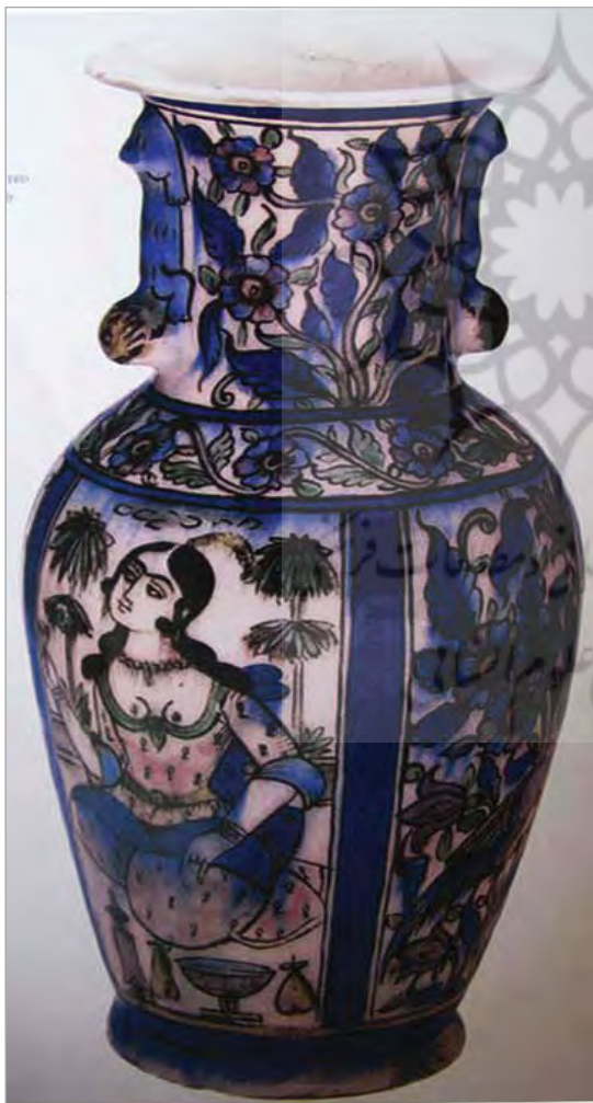
تصویر ۳۴. گلدان سفالینه چند رنگ، موزه طارق رجب، شماره: 364.CER1773TSR