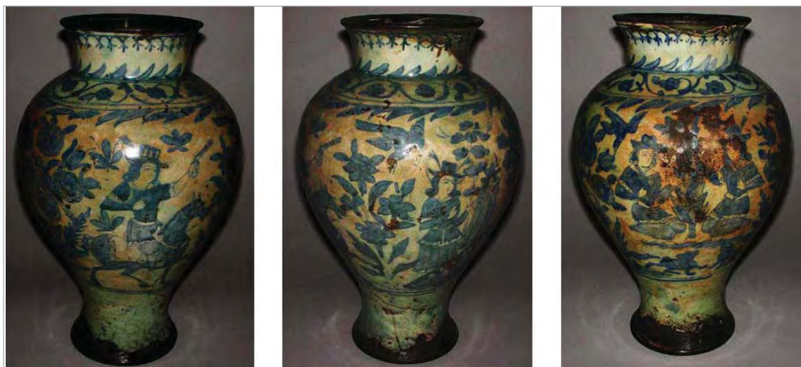
تصویر ۳۳. گلدان، موزه فیتز ویلیام، شماره: (http://www.fitzmuseum.cam.ac.uk/). C.84-1911