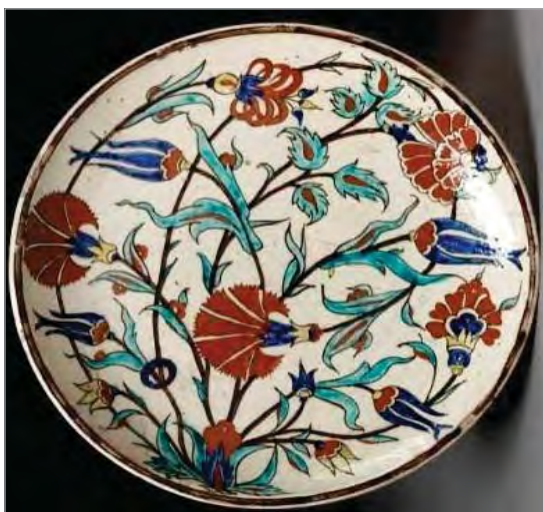
تصویر ۲۹. بشقاب، موزه ویکتوریا و آلبرت، شماره: 948-1898 ( http://v&a.museum.collections.vam.ac.uk ).