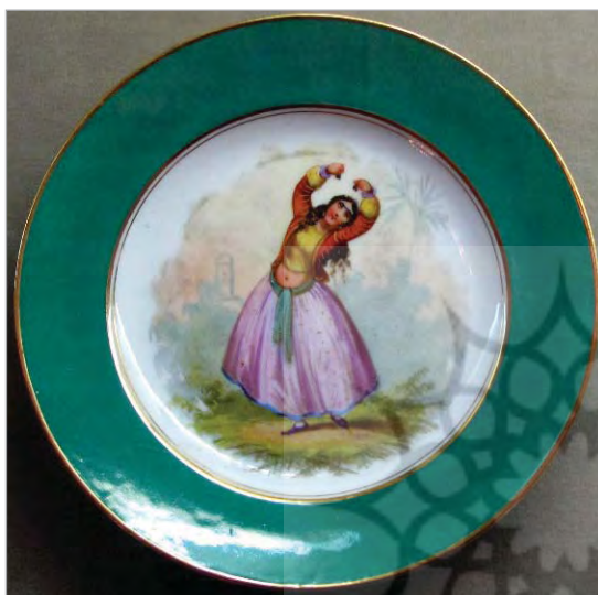
تصویر ۲. دیس چینی، ساخت انگلیس، موزه قاجار تبریز (نگارندگان).

بین چینی‌آلاتی که به ایران وارد می‌شده، ظروف ساخت انگلیس و چین بیشتر از سایر نمونه‌های مشابه وارداتی بر طرح و نقش سفالینه‌های تولیدشده در داخل تأثیرگذار