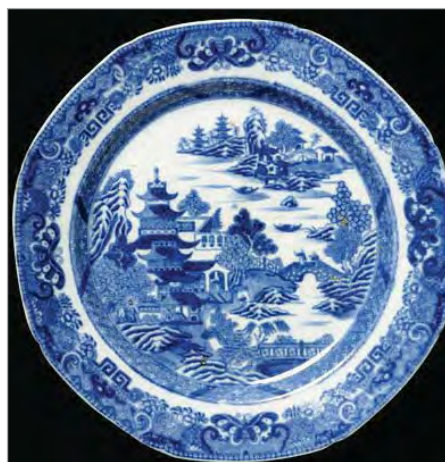
تصویر ۷. بشقاب، ساخت انگلیس، موزه ویکتوریا و آلبرت، شماره: CIRC.239-1916 ( http://v&a museum.collections.vam.ac.uk ).