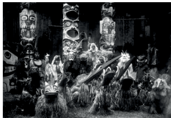
تصویر ۹. رقصندگان صورتک دار، کواکیوتل. مؤسسه هنری شیکاگو (مأخذ: گاردنر، ۱۳۸۵: ۷۵۷)