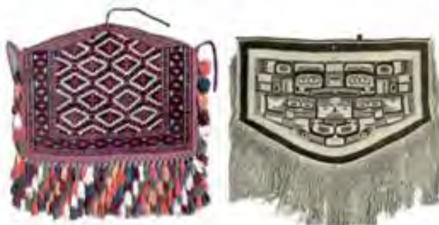
تصویر ۱۷. آسمالیک و چیلکات با تزئین های آویزی