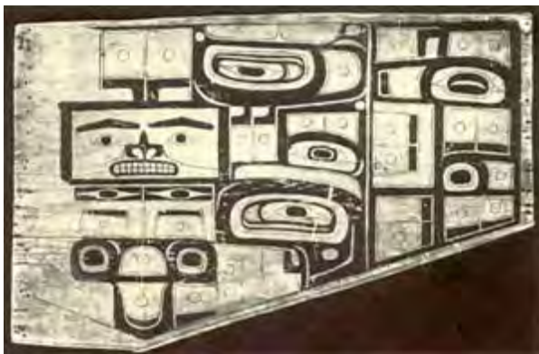
تصویر ۱۴. طراحی نقشه بافت بر روی تخته توسط مردان قبیله