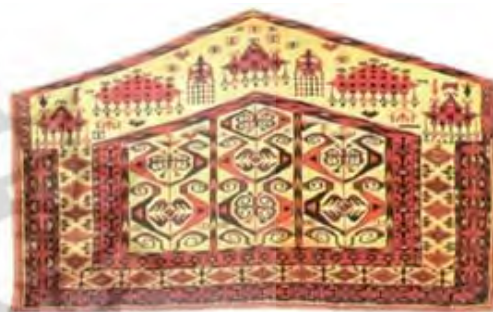
تصویر ۱۹. آسمالیک جواهری با طرح جواهرات زنانه در قسمت بالای بافته