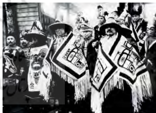
تصویر ۱۱. مراسم اسکیموها، آلاسکا، ۱۹۰۴م، مردان و بزرگان قبیله با پوشش های خاص خود

برگزاری جشن هایی موسوم به پُلِتاج ۲۶ به تن می‌کردند» (Dubin, 1999: 403).