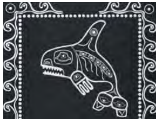
تصویر ۱۳. نشان وال قاتل، سده بیست؛ بازنمایی شده به شیوه اشعه ایکس (مأخذ: همان)

۵. تمامی دواپر کامل کوچک، به جز آن ها که در میان پلک چشمان قرار گرفته اند، سفید هستند. ۶. اشکال S مانندی که در پایه برخی نقوش V شکل یافت می شوند، همواره سفیدرنگ اند. ۷. هر زمان که شکل V کوچک در میان سر یک ماء فزل آلائی طلایی قرار بگیرد، آبی رنگ می شود. ۸. دهان های نقوشی که به شکل سر هستند، همیشه آبی رنگ می شود. ۹. اشکال آبی رنگ هیچ گاه اشکال دیگری را که به رنگ آبی هستند، احاطه نمی کنند. ۱۰. به طور عمده نقوش آبی رنگ در کنار یکدیگر قرار نمی گیرند، حتی زمانی که با خطی سیاه از هم جدا شده باشند. ۱۱. کاسه چشم ها و اتصال آنها پیوسته زرد است. بنابراین عقیده برخی از محققان غرب شناس «رنگ های سیاه و زرد، از آنجا که رنگ طبیعی پشم رنگ نشده هستند، به عنوان طیف های غالب در بافندگی به حساب می آیند» (Shearar, 2000: 29)، رنگ آبی هم رنگ ثانویه شناخته می شود. به هر حال منسوجات بومیان منطقه، با بیان اعتبار اجتماعی افراد در مراسم خاص، نشان دهنده شاخصه ها و پشتوانه های تاریخی و فرهنگی هستند و همین امر باعث گرایش محققان و کاوش گران غرب و شرق برای مطالعه آثار آنان شده است. روی هم رفته بررسی این آثار در کنار سایر هنرهای این قوم مسئله چندان ساده ای نیست و نیاز به نفوذ در عمق عقاید و باورهای آنها دارد، آن چنان که «هنر ظریف، دقیق و پیشرفته ساحل شمال غربی در نظر بسیاری از منتقدان هنر یکی از بغرنج ترین دستاوردهای معنوی سرخپوستان آمریکایی است» (گاردنر، ۱۳۸۵: ۷۶۳).