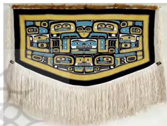
تصویر ۱۰. چیلکات