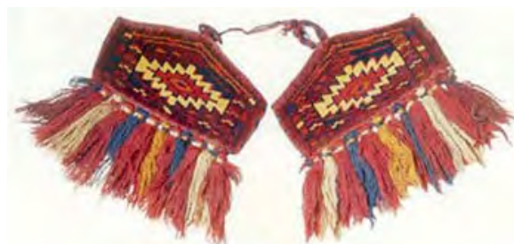
تصویر ۶. دبه دیزلیق بافته‌ای تزئینی جهت پوشش زانوی شتر

امروزه، درخصوص چگونگی راه یافتن بومیان امریکا، به ویژه ساکنان شمالی آن به این قاره فرضیاتی ارائه شده است که مهم‌ترین آنها حاکی از ورود آمریندین‌ها از بخش‌هایی از سیبری و آسیای مرکزی و شرقی است (یعنی جایی که زمانی خاستگاه اقوام ترک و ترکمن کنونی که بدان‌ها اشاره شد، بوده است). براساس این نظر، «گمان می‌رود که انسان‌ها نخستین بار در آخرین عصر یخبندان که حدود بیست هزار سال پیش اتفاق افتاد، از طریق کمربندی از یخ که شمال سیبری را به آمریکای امروزی متصل می‌کرد به این خطه گام نهاده‌اند» (Forty, 1999:340) و در پی آن با سرازیر شدن به بخش‌های جنوبی قاره، تمدن‌ها و سکونت‌گاه‌های خود را بنا کرده‌اند که البته برخی چنین تصویری را دور از ذهن می‌پندارند. اما به هر حال این فرضیه تاکنون نسبت به سایر نظریات پشتوانه‌های مستحکم‌تری داشته و مقبول‌تر از سایرین قلمداد شده است. در جایی دیگر بیان شده که «ساکنان اولیهٔ آمریکا، مهاجرانی از آسیای شرقی ۱۷ بوده‌اند که در ابتدا از پلی یخی که زمانی سیبری و آلاسکا را به هم مرتبط می‌ساخته است و امروزه وجود ندارد، عبور کرده‌اند (۶۰ تا ۳۵