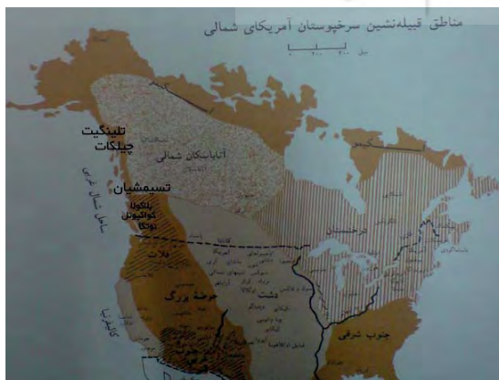
تصویر ۸.

نواحی غربی آمریکای شمالی به ویژه نواری که بخش‌هایی از آلاسکا و غرب ایالت بریتیش کلمبیا ۱۸ (کلمبیای بریتانیا)