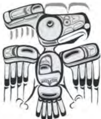
تصویر ۱۲. نشان عقاب، قبیله هاید، سده ۱۹م؛ بازنمایی شده به شیوه اشعه ایکس (Wilson, 2001: 93)

در روشی دیگر که در میان بافته‌های عنوان شده بیشتر به کار می‌آید، شیوه مرسوم ساده سازی و استیلیزه کردن نقوش است که در بافته های چیلکات اغلب در هبیت عقاب، خرس و جانواران دریایی شیوه نگاری شده جلوه می‌کند. در اصل، این طرح‌ها باید حاکی از نشان و علامت اجدادی این اقوام باشند که تا به امروز ترکیب و ساختار خود را حفظ کرده‌اند. در این شیوه بازنمایی که به نحوی با نوع پیشین خود متفاوت است، علاوه بر ساده سازی نقش و تبدیل آن به یک سری اشکال هندسی، روشی تکمیلی نیز به کار گرفته شده و آن پراکنده ساختن اعضای تصویر به کار رفته در سطح اجرایی کار، آن هم به صورت قرینه است (به تصویر ۱۱ نگاه کنید).