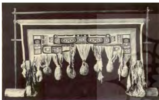
تصویر ۲۰. دار بافندگی چیلکات