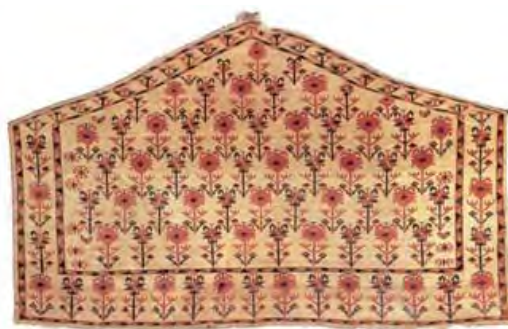
تصویر ۲. آسمالیک ساریقی، ۱۳۵*۸۴ سانتیمتر، سده ۱۹ م (همان: ۹-۳۰۸)

پنج ضلعی تهیه می شوند، اما نمونه های هفت ضلعی آن هم وجود دارد که در آن مثلثی کوچک روی یک سطح مستطیل شکل قرار گرفته است (تصویر ۳).