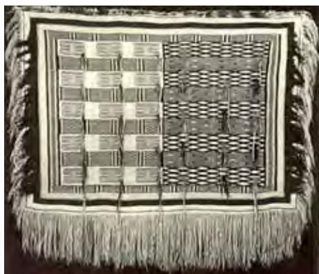
تصویر ۱۸. چیلکات چهارضلعی، از نمونه های اولیه بافته های چیلکات