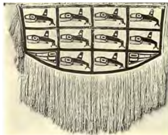
تصویر ۱۵. چیلکات با نقش وال قاتل، متفاوت با انواع دیگر بازنمایی روی موارد مشابه این بافته

چیلکات‌های اسکیمویی و بافته‌های آسمالیک هر دو به لحاظ شکل ظاهری در قالب پنج ضلعی هستند. در یکی رأس به سمت بالاست (که ممکن است برگرفته از پدیده‌های طبیعی اطراف محل زندگی مثل کوه یا تپه باشد) و در دیگری رو به پایین است (که شاید به دلیل نوع کاربرد آن روی بدن انسان باشد) و معمولاً در تزئین آنها از منگوله و نوارهای آویزان استفاده می‌شود (تصویر ۱۷). البته، همان‌طور که اشاره شد آسمالیک هفت ضلعی هم وجود دارد، از طرفی در بعضی موارد چیلکات چهار ضلعی نیز مشاهده شده است (به خصوص چیلکات‌های اولیه) (تصویر ۱۸). اما در هر صورت، انواع پنج‌ضلعی آنها شایع‌تر است. ابعاد بافته‌های چیلکات بنا بر نوع استفاده انسانی شان متناسب با بدن ساخته می‌شوند؛ در حالی که آسمالیک‌ها که در دو طرف شتر آویزان می‌شوند، طبیعتاً اندازه بزرگ‌تری دارند.