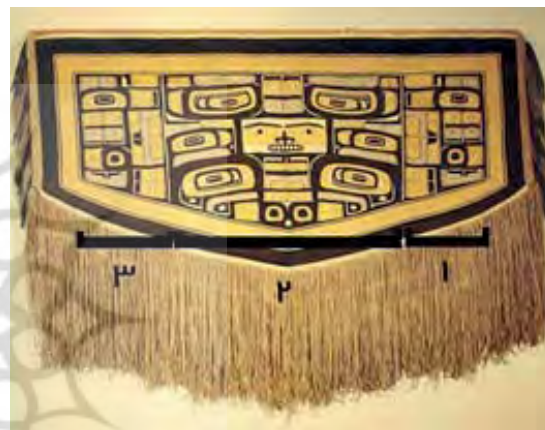
تصویر ۱۶. چیلکات در اشکال سه بخشی (مأخذ: Harris, 1995: 265)