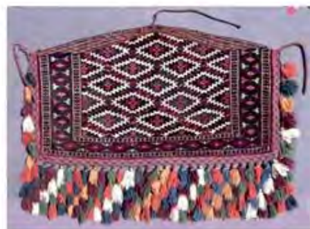
تصاویر ۴ و ۵. شتر جشن عروسی ترکمن به همراه کجاوه و آسمالیک روی پشت؛ آسمالیک یموت با طرح و نقش مشابه در تصویر بالا، حدود ۱۹۰۰ م، ۹۱*۱۱۴ سانتیمتر و رنگ طبیعی