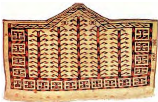
تصویر ۳. آسمالیک هفت ضلعی یموت، سده ی ۱۹ م (همان: ۳۰۷)