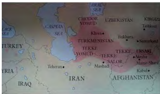
تصویر ۱. قلمرو ترکمنان و سایر قبایل ترک زبان