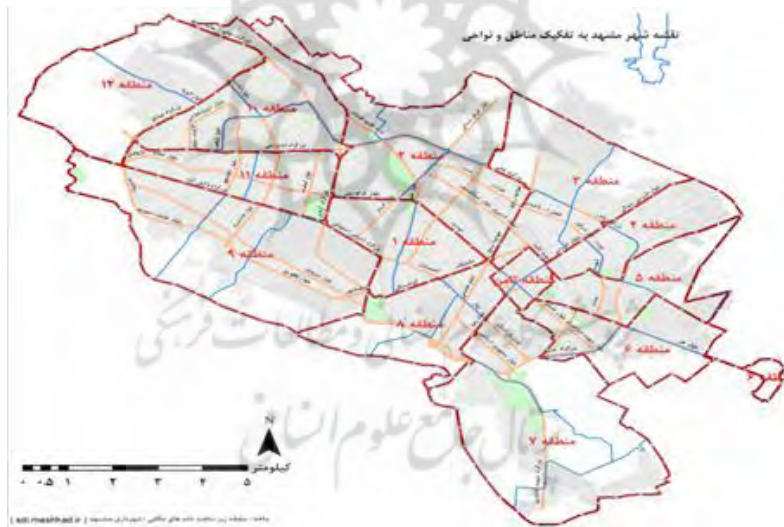
شکل شماره ۱: نقشه مناطق شهر مشهد

روش تحقیق مطالعه حاضر پیمایش می‌باشد. از نظر وسعت پهنانگر و از نظر محتوا از نوع کاربردی است. جامعه آماری این پژوهش کلیه شهروندان بالای ۱۵ سال ساکن مناطق ۱۳ گانه شهرداری شهر مشهد می‌باشد که مطابق نتایج سرشماری نفوس و مسکن سال ۱۳۹۵ برابر با ۳۰۰۱۱۸۴ نفر می‌باشد. حجم نمونه آماری با استفاده از فرمول کوکران مشخص شد. بدین منظور حداکثر واریانس در متغیر وابسته در نظر گرفته شد ( p, q = 0.5 ) و جاگذاری آن در فرمول کوکران، حجم نمونه برآورد شد.