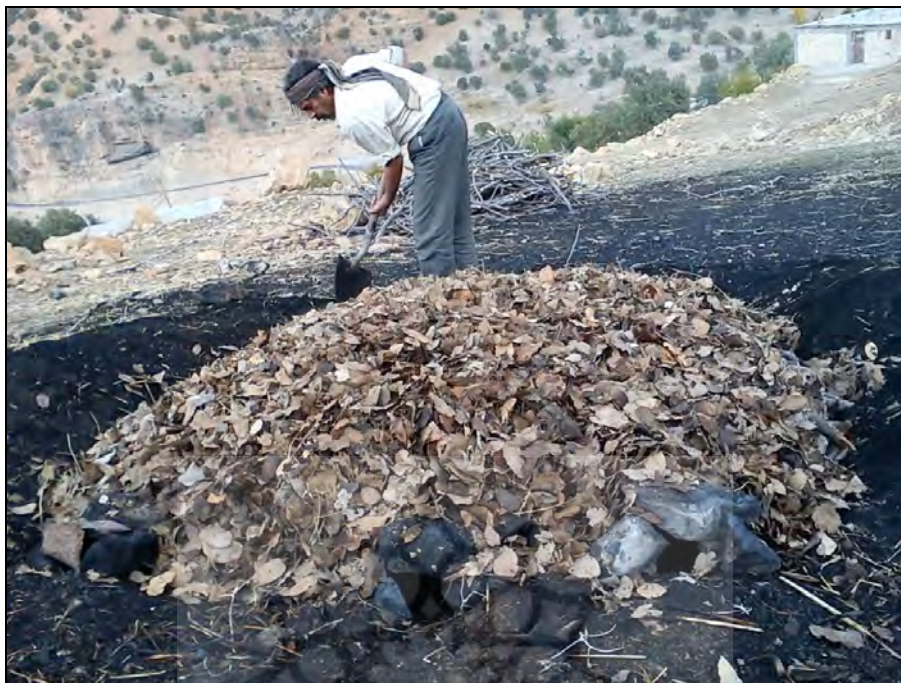
شکل ۵- پوشاندن کامل سطح چوب‌ها به‌وسیله برگ خشک‌شده درختان بلوط