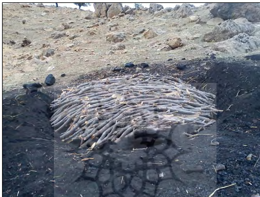
شکل ۳- مرتب کردن قطعه‌های چوب در کوره زغال‌گیری

به‌وسیله هیزم‌های با قطر کمتر پوشانده می‌شود تا حالتی عایق ایجاد کرده که خاک و برگ‌ها به داخل کوره وارد نشوند.