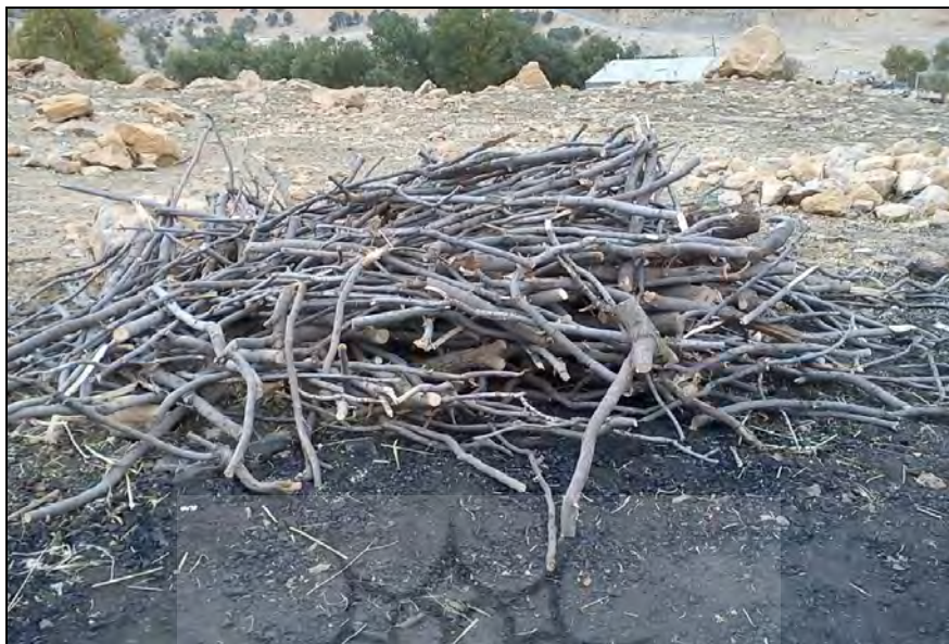
شکل ۲- تبدیل تنه و ساقه خشک‌شده درخت به قطعه‌های کوچک یک تا یک و نیم متری (منبع: پژوهشگران)