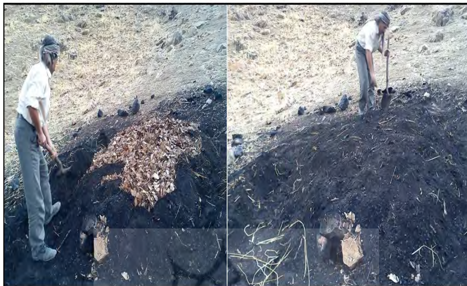
شکل ۶- ریختن خاک یا خاکستر روی کل سطح برگ‌هایی که روی قطعات چوبی گذاشته شده‌اند.

- روشن کردن کوره زغال‌گیری به وسیله آتش از دهانه دودکش ورودی و