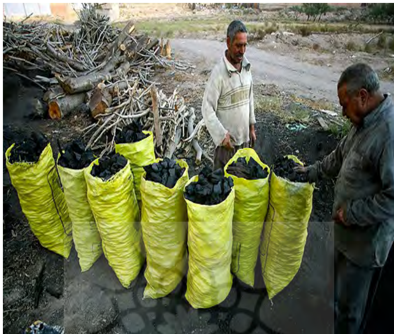
شکل ۷- زغال تهیه‌شده از بلوط

بر اساس اظهارنظر مردم محلی، به‌طور میانگین، در هر نوبت زغال‌گیری از یک کوره متوسط، تقریباً ۲۰۰ کیلوگرم زغال تولید می‌شود. قیمت یک کیلوگرم زغال در سال ۱۳۹۸ معادل ۶ هزار تومان بوده که در سال ۱۳۹۹ با توجه به کیفیت و درجه خلوص آن بین ۱۵ تا ۳۰ هزار تومان معامله‌شده است. از این‌رو با مدیریت مناسب و تخصیص چوب‌های خشکیده، آفت‌زده، بادافتاده و بقایای هرس درختان باغی برای زغال‌گیری ضمن حفظ این دانش بومی به‌نوعی برای روستاییان درآمدزایی صورت خواهد گرفت.