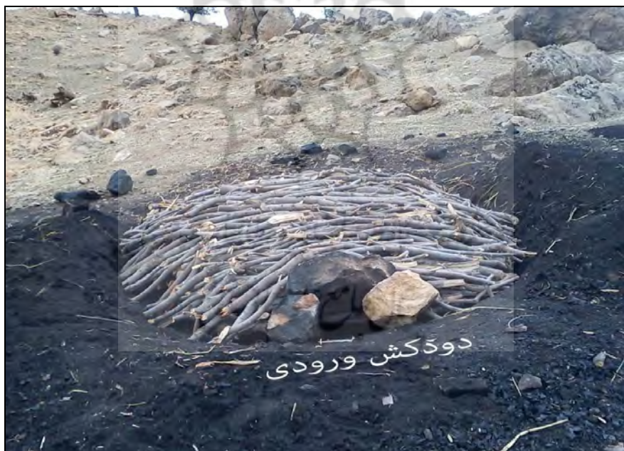
شکل ۴- نصب دودکش در دهانه ورودی و خروجی کوره زغال‌گیری

به‌منظور تأمین سوخت لازم جهت حرارت دادن به هیزم‌ها برای تبدیل شدن به زغال یا کربن، سطح هیزم‌ها به وسیله برگ درختان به صورت کامل پوشش داده می‌شود که هرچقدر اندازه کوره بزرگ‌تر باشد از برگ بیشتری استفاده می‌شود. همچنین این برگ‌ها باعث می‌شود که حرارت به صورت متعادل به چوب‌ها داده شود زیرا اگر حرارت موردنظر از این مقدار بیشتر شود، زغال یا کربن تولیدشده تبدیل به خاکستر می‌شود.