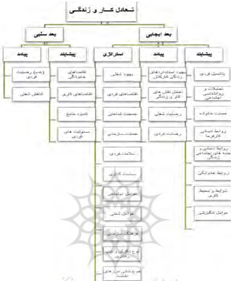
شکل ۳. مدل تبیین شده تعادل کار - زندگی