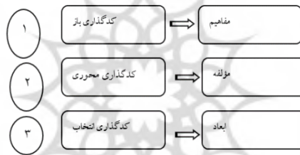
شکل ۲. رابطه انواع کدگذاری و مفاهیم، مؤلفه و ابعاد

در تمام مراحل روش فراترکیب، پژوهشگر به طور پیوسته و مداوم مقالات نهایی را، به منظور دستیابی به نتایج درون محتوایی، مورد بررسی قرار می دهد و با مطالعه‌ی دقیق هر مقاله به استخراج مفاهیم معنی دار و سپس استخراج گزاره‌ها پرداخته شده است. در این پژوهش از کدگذاری باز، کدگذاری محوری و کدگذاری انتخابی استفاده گردیده است.