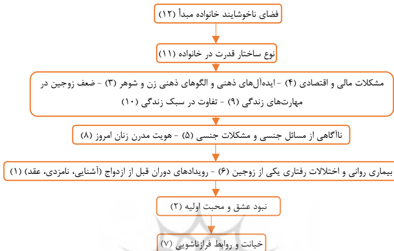
شکل ۱: عوامل مؤثر بر تعارضات اولیه زناشویی

تعارضات، با بیشترین نفوذ شناخته شد. عامل «خیانت و روابط فرازناشویی» در سطح اول با بیشترین وابستگی قرار گرفت.