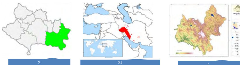
شکل ۲: الف) پراکندگی جمعیتی قوم بختیاری (ب) موقعیت مکانی شهرستان الیگودرز در استان لرستان (ج) نقشه شهرستان الیگودرز

جامعه مورد مطالعه شده شهرستان الیگودرز است این شهرستان با مساحتی ۵۰۰۰ کیلومتر مربع در شرق استان لرستان واقع شده است. جمعیت این شهرستان ۱۳۷۰۵۳۴ هزار نفر است (آمار ایران، ۱۳۹۵: ۱۲) و مردم این شهرستان به زبان لری بختیاری تکلم می‌کنند.