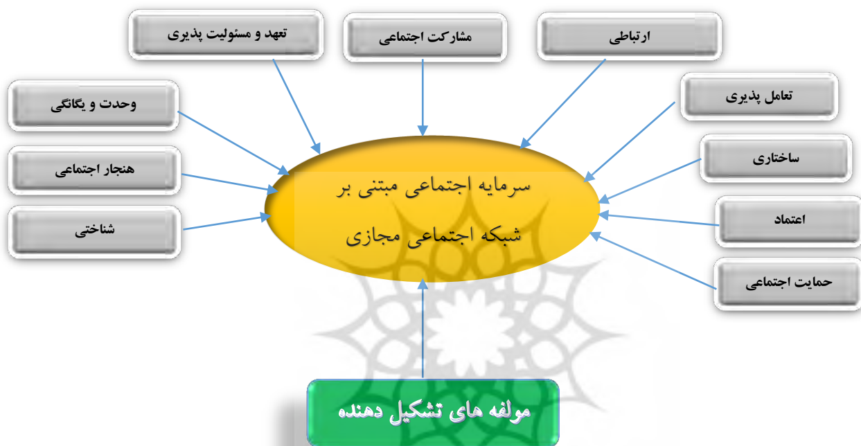
شکل ۱- مدل مفهومی اولیه برگرفته از مبانی نظری و پیشینه تحقیق

بعد از جمع بندی های صورت گرفته ،مولفه های پیشنهادی در قالب چارچوب نظری شامل تعهد و مسئولیت پذیری ۱ ، تعامل پذیری ۲ ، اعتماد ۳ ، مشارکت اجتماعی ۴ ، وحدت و یگانگی ۵ ، حمایت اجتماعی ۶ ، هنجار اجتماعی ۷ ، ساختاری ۸ ، ارتباطی ۹ ، شناختی ۱۰ می باشد. بنابراین با توجه به موضوعات مطرح شده در بیان مساله و پیشینه تحقیقات مدل مفهومی تحقیق به شرح زیر می باشد: