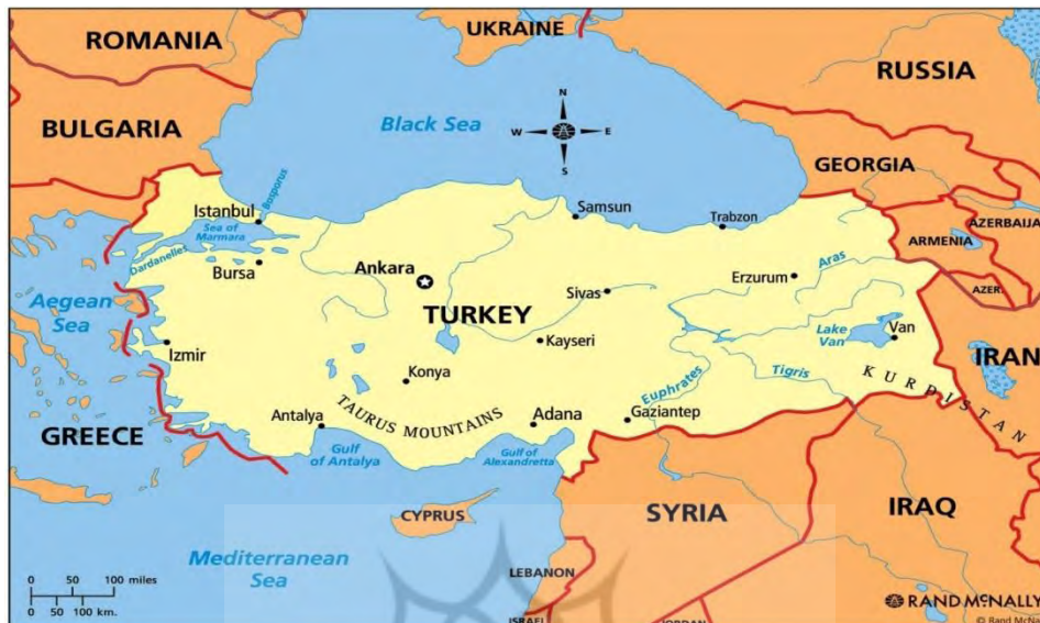
نقشه ۳: کشور ترکیه

کیلومتر و بلغارستان ۲۴۰ کیلومتر. کشور ترکیه ۸۱ استان دارد. مراکز همه استان‌ها به جز سه استان با خود استان همنام هستند. سه استان نامبرده عبارت‌اند از: ختای (مرکز: انتاکیه)، کوجالی (مرکز: ایزمیت)، سقاریه (مرکز: آداپازاری). هر کدام از استان‌های ترکیه به چندین بخش تقسیم شده‌است.