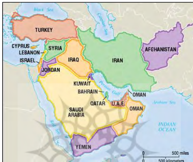
نقشه ۲: کشور ایران

ایران با ۱۶۴۸۱۹۵ کیلومتر مربع وسعت (هفدهم درجهان) و بر پایه سرشماری سال ۱۳۹۵ دارای ۷۹۹۲۶۲۷۰ نفر جمعیت (هفدهم درجهان) است. ایران از شمال با جمهوری آذربایجان، ارمنستان و ترکمنستان، از شرق با افغانستان و پاکستان و از غرب با ترکیه و عراق همسایه است و همچنین از شمال به دریای خزر (کاسپین) و از جنوب به خلیج فارس و دریای عمان محدود می‌شود، که دو منطقه نخست از مناطق مهم استخراج نفت و گاز در جهان هستند. ایران در قلب خاورمیانه همچون پلی دریای مازندران بزرگترین دریاچه جهان را به خلیج فارس و دریای عمان، از شمال به جنوب وصل میکند و گذرگاهی است برای ارتباطات فرهنگی - سیاسی دنیای شرق و غرب.