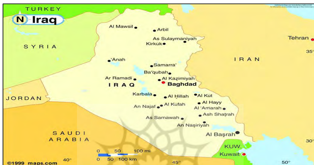
نقشه ۳: موقعیت کشور عراق

سه بادیه (منطقه صحرائی) تقسیم می‌شود. شهرهای عمده آن عبارتند از: بغداد، موصل، بصره، کرکوک، کربلا، نجف، حلّه، ناصریه، سلیمانیه. عراق با ۳۲۵۸۵۶۹۲ نفر (آمار ژوئیه ۲۰۱۴) جمعیت چهلمین کشور پرجمعیت جهان است. عرب‌ها ۷۵ درصد-۸۰ درصد، کردها ۱۵ درصد-۲۰ درصد، ترکمنان، آشوریان و غیره نزدیک ۵ درصد از جمعیت عراق را تشکیل می‌دهند. همچنین حدود ۶۰ درصد-۶۵ درصد مردم عراق شیعه، ۳۲ درصد-۳۷ درصد سنی و ۳ درصد مسیحی و پیروان دیگر ادیان هستند.