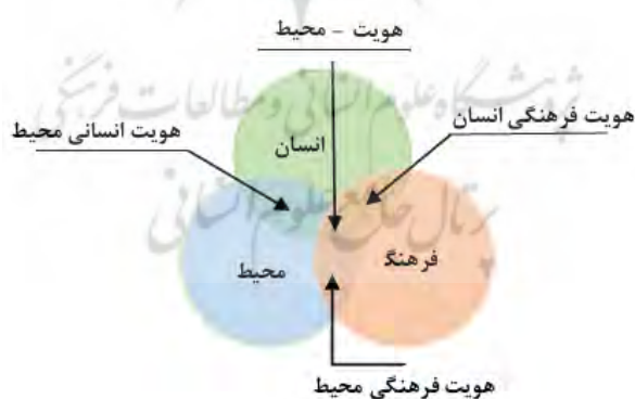
نمودار ۱- ارتباط انسان، فرهنگ، محیط و نسبت آنها با هویت

هویت با سه مقوله مکان (جغرافیایی)، فضا (شبکه‌ها و روابط اجتماعی) و زمان (تاریخ) پیوند دارد و از ویژگی‌ها و تحولات این سه مقوله متاثر می‌شود. بنابراین می‌توان مسائل مربوط به هویت را با بررسی پدیده‌هایی که حاوی این سه عنصر هستند مورد بررسی قرار داد. بر این اساس مکان‌ها و محیط‌های بادوام زندگی اجتماعی نظیر، خانواده، محله، روستا، شهر، قبیله و همچنین تعلق‌های بادوام اجتماعی، نظیر صنف، قشر، طبقه و کشور هر کدام می‌توانند عرصه‌ای برای شکل‌گیری، تداوم و تحول هویت و به تبع آن زمینه‌ای برای بررسی مسائل مربوط به هویت باشند. (بشیری، ۱۳۸۳: ۱۱۶) از آنجایی که هویت بوسیله عناصر مشخصه و تشکیل‌دهنده آن مانند مکان، محل و موقعیت قابل تبیین است، می‌توان آن را به عنوان شاخص موثر در تشخیص فضاها و تمایز آنها به کار برد و آن را به عنوان یک شاخص فضایی مورد کنکاش قرار داد. (حافظ‌نیا و همکاران، ۱۳۹۱: ۱۰۹) فرهنگ و محیط، هویت‌ساز زندگی انسان می‌باشند، به نحوی که هر کدام نقش اساسی در تشکیل هویت بر عهده دارند. بدین ترتیب می‌توان فصل مشترک هویت انسانی محیط و هویت فرهنگی انسان را هویت محیط نشان داد. (نمودار ۱).