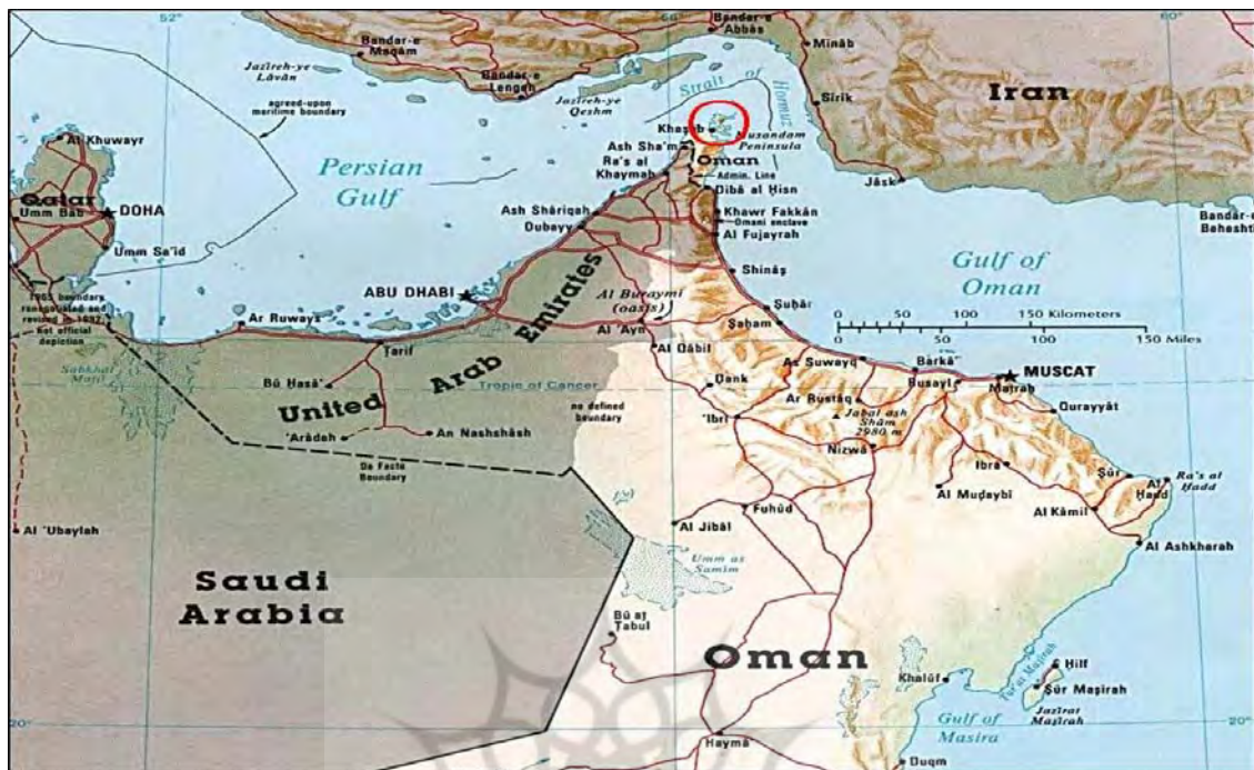
نقشه شماره ۲-نمایی از تنگه هرمز و جزیره قشم

قبل از حمله اسکندر به ایران کشتی‌های تجاری و... در شوش لنگر می‌انداختند یعنی شوش به دریا متصل بوده است درحالی‌که امروز دریا پس رفته و از شوش فاصله گرفته است (غلامی، ۱۳۹۱).