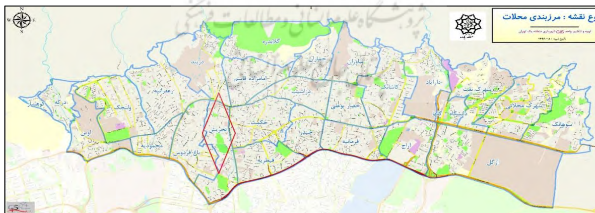
شکل ۳- نقشه منطقه تجریش

با گسترش شهر تهران و تثبیت نظام شهرنشینی در دهه های ۳۰ و ۴۰ منطقه به دلیل داشتن ارزشهای زیست محیطی فراوان موردتوجه اقشار پر درآمد و افراد حکومتی و سفارتخانه های خارجی قرار گرفت. وجود امامزاده صالح، دو مجموعه سلطنتی مهم نیاوران و سعدآباد، باشگاههای وزارتخانه ها و نهادهای دولتی، منازل مسکونی مدیران و روسای ادارات و سفارتخانه های خارجی نشان دهنده ارزش بالای این منطقه و جذابیت زندگی در آن بوده است. در دهه های ۶۰ و ۷۰ با وجود خالی بودن مناطق جنوبی و شرقی تمایل به ساخت و ساز در نواحی شمالی در محدوده ارتفاعی ۱۶۰۰ تا ۱۸۰۰ منطقه یک بیشتر بوده است. نقشه ۲ سیر تحول منطقه یک را در ساخت و ساز از سال ۳۴ تا ۷۷ نشان می دهد.