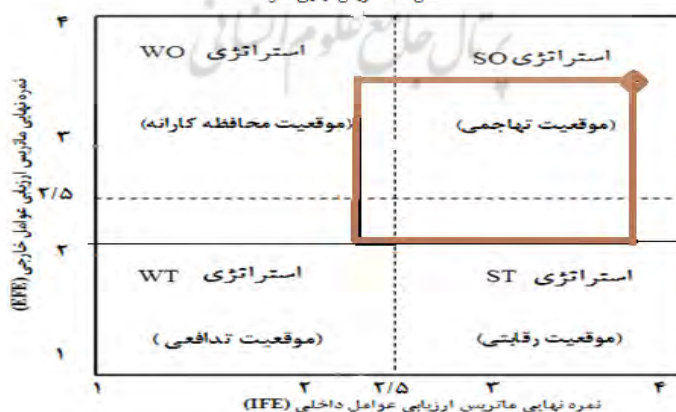
شکل ۱: ماتریس نهایی سوات