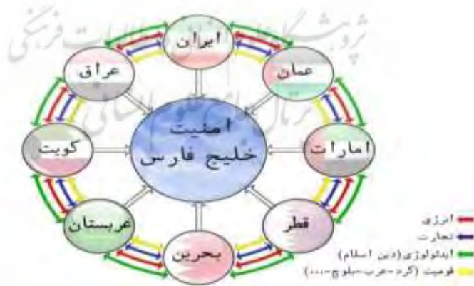
مدل ۱- ترتیبات امنیتی بومی از طریق مولفه های همگرایی

ایده این پژوهش در موضوع ارائه الگوی نوین امنیت سازی در خلیج فارس مبتنی بر مشارکت کشورهای ساحلی این منطقه برای رسیدن به ترتیبات امنیتی بومی می باشد و تعامل و همکاری با قدرت های فرامنطقه ای بر اساس کد