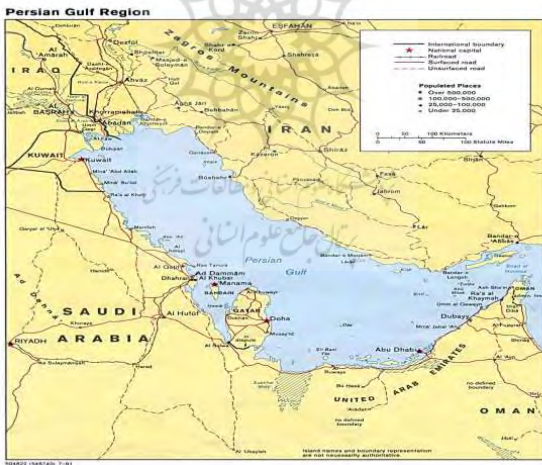
نقشه شماره ۱: موقعیت جغرافیایی خلیج فارس www.persiangulfstudies.com

نام تاریخی این خلیج در زبانهای گوناگون و نقشه های کهن که در این باره منتشر شده است، ترجمه عبارت خلیج فارس یا دریای پارس بوده است. همچنین در تمام رسانه های بین المللی نام رسمی این خلیج، «خلیج فارس» است. خلیج فارس، نام پیشرفتگی دریایی است در خشکی که بین ایران و شبه جزیره عربستان واقع است که از شطالعرب به سوی جنوب شرقی تا شبه جزیره مسندم در عمان ممتد است که به وسیله تنگه هرمز و از طریق دریای عمان به اقیانوس هند ارتباط دارد. منطقه خلیج فارس شامل هشت کشور ساحلی است که از شمال به طرف جنوب عبارتند از: ایران، عراق، کویت، عربستان سعودی، بحرین، قطر، امارات متحده عربی و عمان می باشد که به غیر از ایران که پارس نژاد است، دیگر کشورهای ساحلی این منطقه عرب زبان هستند.