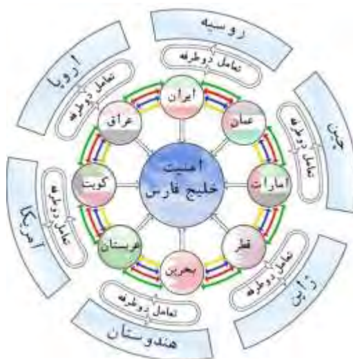
مدل ۲- ترتیبات امنیتی بومی از طریق مولفه های همگرایی در تعامل با قدرتهای فرامنطقه ای (۸+۶)

ژئوپولیتیکی منطقه ای کشورهای حوزه خلیج فارس در یک چارچوب همکاری متقابل و دوطرفه با معادله قدرت ۸+۶ پیش بینی گردیده که در مدل ۲ تشریح شده است.