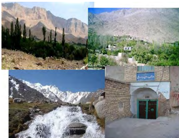
شکل ۲- جاذبه‌های گردشگری مجموعه روستایی ده بالا