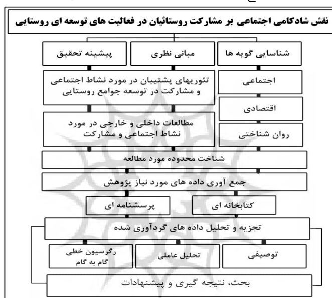
شکل ۲: مدل اجرایی پژوهش

به طور کلی مراحل انجام تحقیق در این پژوهش مشتمل بر ۶ مرحله می‌باشد که با طراحی موضوع شروع شده و پس از تدوین مبانی نظری، گویه‌های مرتبط بانشاط اجتماعی و مشارکت روستائیان انتخاب شده و در نهایت داده‌های مورد نیاز از طریق منابع کتابخانه‌ای و توزیع پرسشنامه در محدوده مورد مطالعه گردآوری شده است و در نهایت در محیط spss اقدام به تجزیه و تحلیل داده با استفاده از آزمون‌های آماری تحلیل عاملی و رگرسیون گام‌به‌گام شده است و در نهایت نیز با توجه به نتایج به دست آمده از داده‌های پرسشنامه و همچنین ویژگی‌های اجتماعی، اقتصادی و محیطی منطقه پیشنهادهایی در جهت رفع مشکلات ارائه گردیده است. (شکل ۱)