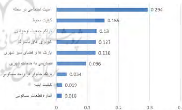
شکل ۱. میزان اهمیت شاخص‌ها

پرسش‌نامه‌های تدوین و بین ۱۵ نفر از متخصصان امور شهری و سایر دست‌اندرکاران مرتبط با مسائل نوجوانان توزیع شد و از آنان خواسته شد تا به شاخص‌های موردنظر امتیاز دهند. سپس پرسش‌نامه‌ها در نرم‌افزار EXPERT CHOISE وارد شده و وزن هر شاخص به دست آمد و پرسش‌نامه‌هایی که دارای خطای بالابودند حذف گردید و از بین پرسش‌نامه‌های باقی‌مانده میانگین وزن شاخص‌ها محاسبه شد که شکل ۱ میزان اهمیت هر یک از شاخص‌ها را نشان می‌دهد.