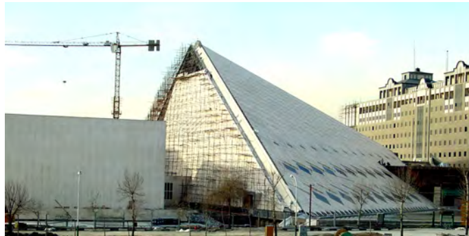
شکل ۵. استفاده از فرم خالص هرم در طراحی ساختمان مجلس شورای اسلامی (ماخذ: ستاوبن، ۱۳۹۵). طراح پروژه در توصیف طرح بیان می‌دارد: «یکی از عوامل مؤثر در شکل‌گیری بنای مجلس، تناسب و ارتفاع و عملکرد دو بنای شمالی و جنوبی بوده است تا این بنا بتواند ضمن استفاده مداوم از دو بنای موجود با محیط اطراف خود نیز هماهنگی کامل را برقرار کند.» (ماخذ: ذکابی، ۱۳۷۸، ۲۹)

در تبیین آن داشته باشد. ارزیابی تأثیر بافت و موقعیت پروژه بر نمود کالبدی آن، از اهداف دیگر چنین پژوهش‌هایی خواهد بود. برای تأمین این چنین هدفی منتقد می‌تواند پس از شناسایی اهداف موردنظر کارفرما، از مردم و یا متخصصان سوال نماید که آیا بنای ساخته شده (شکل ۳) توانسته است به نیازهای از قبل تعیین شده پاسخ دهد یا خیر؟ آیا محیط بعد از ساخته شدن بنای جدید، به محیطی بهتر و مناسب‌تر برای زندگی و گذران اوقات فراغت تبدیل شده یا خیر؟