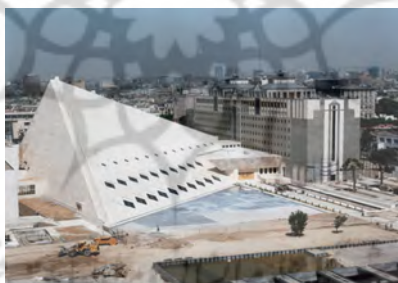
شکل ۳. نمای کلی ساختمان مجلس شورای اسلامی طراحی عبدالرضا ذکایی با همکاری علی سردارافخمی، عباس قریب، مسعود قاضی زاهدی، منصور وکیلی، داریوش فیروزلی و بهروز احمدی