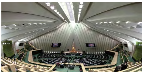
شکل ۴. چشم انداز داخلی ساختمان مجلس شورای اسلامی