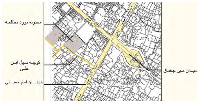
شکل ۱. نقشه موقعیت محدوده مورد مطالعه

در این پژوهش با توجه به کیفیت حیات‌بخش خانه‌های سنتی یزد و