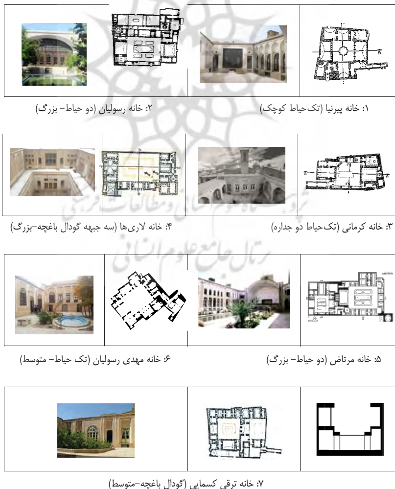
جدول ۲. معرفی خانه‌های مورد بررسی به‌عنوان نمونه‌های موردی

بر اساس شیوه رهیافت نظام‌مند، نظریه‌پردازی در سه گام اصلی انجام شده است که در گام اول (کدگذاری باز) ابتدا متن مصاحبه‌ها