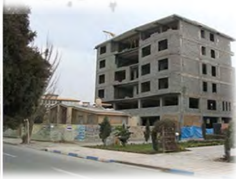
شکل ۲. الگوی غالب آپارتمان سازی در مهرشهر