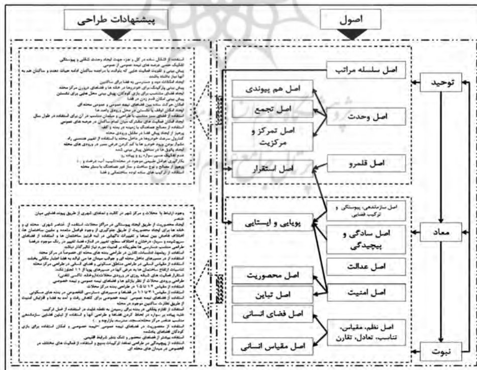
شکل ۱. اصول و پیشنهادهای طراحی در محلات شهری

در زمین ببیند. این مکتب بر آن است تا تعاون و توازن (تعادل فضایی و توازن کالبدی) را در جلوه‌ای با نام تقارن و فضاها متقارن و دیگر بسترها بروز دهد. القای فضای انسانی در برابر مقیاس انسانی، مرکزیت آرمانی در برابر مرکزیت هندسی و تبدیل مرکزیت هندسی شهر بیش از آن به مرکزیت عقیدتی-سیاسی و اجتماعی-فرهنگی از اهداف دیگر مکتب اصفهان است. از ویژگی‌های دیگر می‌توان به سیالیت و تداوم فضایی نیز از دیگر مفاهیم این مکتب است به عبارتی این مکتب با ایجاد بناها و مجموعه‌های مردم‌وار، هویت خویش را از آنان اخذ کرده و به آنها هویت می‌دهد (حبیبی، ۱۳۷۸). بررسی‌های تاریخی در مورد شهرهای گذشته نشان می‌دهد که این شهرها تحت تأثیر عوامل اقلیمی و فرهنگی-اجتماعی و اقتصادی شکل فضایی خاصی پیدا کرده‌اند. این شکل فضایی در مواردی آن قدر قوی است، که حتی به کمک یک نقشه دو بعدی یا یک عکس هوایی ساده می‌توان ترکیب آن را تشخیص داد. پیشگامانی که جنبه‌های شکلی و فضایی شهر را مورد مطالعه خود قرار داده‌اند، هر یک روش‌هایی برای مطالعه چند نمونه شهر پیش گرفتند و سر انجام ماحصل مطالعات خود را به صورت قواعدی برای مطالعه شهرها ارائه کردند (توسلی و بنیادی،