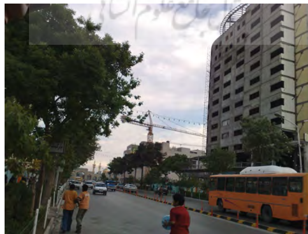
شکل ۲. نمونه‌ای از احداث ساختمان‌های بلند مشرف به حرم رضوی