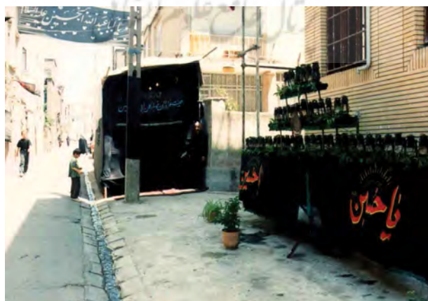
شکل ۵. فضای نامناسب تکیه (فقدان فضای مناسب در محله، مردم را به برپایی حداقل‌ها سوق می‌دهد)