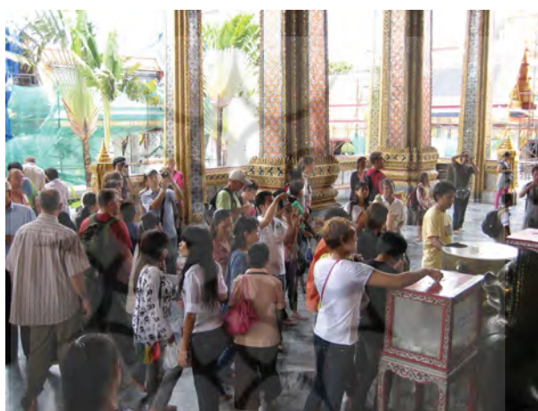
شکل ۷. معبدی بودایی (تایلند)