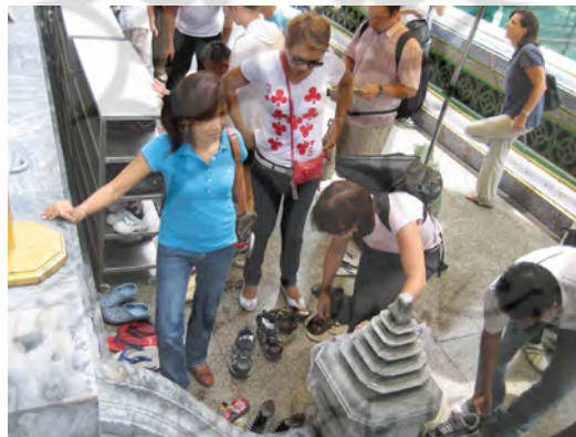
شکل ۱۰. رعایت آداب ورود به معبد بودایی با پاهای برهنه

هستند)، و البته در جوامع و تمدن‌های مختلف تمایزاتی بنیادین با یکدیگر دارند، نیز در آنها دخیل می‌شوند، دقت و توجهی دوچندان را طلب می‌کند. دقت و توجهی که تکرار و تقلید از الگوهای بیگانه را منتفی کرده، و مضاف بر آن، حضور عنصری مقدس در یک بافت شهری، آن بافت را از بافت‌های مشابه کاملاً متمایز می‌کند و لزوم تهیهی طرح و برنامه‌ای ویژه برای آن را حتمی می‌نماید. به این ترتیب، گام اول، شناخت مبانی شکل‌دهندهی وضع موجود هستند. به بیان دیگر، علی‌رغم اهمیت و جایگاه شناخت ویژگی‌های کالبدی و اجتماعی و اقتصادی وضع موجود، شناخت اصول