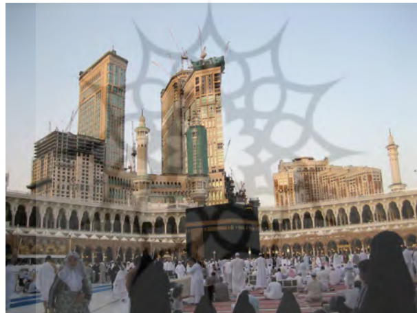
شکل ۱. مکه‌ی مکرمه (ساختمان‌های «بی‌ادبی» که یونسکو به آن اعتراض نمی‌کند)

میراث فرهنگی: توجه شود که میراث فرهنگی علاوه بر همه‌ی ویژگی‌هایی که برایش ذکر می‌شود، یک سرمایه‌ی اجتماعی و فرهنگی است. میراث فرهنگی سرمایه‌ی اولیه برای توسعه و پیشرفت فرهنگ و زمینه‌های وابسته به آن است. و این همان چیزی است که در دوران جهانی‌سازی جوامعی که می‌خواهند هویت خود را حفظ کنند سخت به آن محتاج هستند. این زمینه، به شدت متأثر از بیگانگان است و معیاری وجود ندارد. مثلاً مقایسه کنید، آنچه را که در اصفهان بر میدان نقش جهان رفته است، با اوضاع مکه‌ی مکرمه و مشهد مقدس را. در مورد میدان نقش جهان، علی‌رغم فاصله‌ی نسبتاً زیاد و حتی عدم سیطره‌ی ساختمان جهان‌نما بر میدان، با توجه به اعتراض