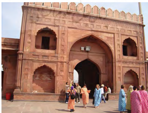
شکل ۸. مسجد دهلی (پذیرای گردشگران با شرایط خاص لباس از نظر پوشیدگی و برهنگی پاها)