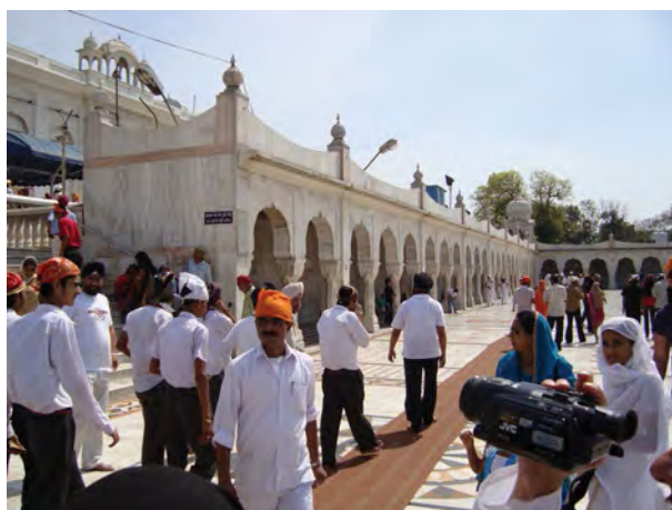
شکل ۶. معبد سیکها (هند)