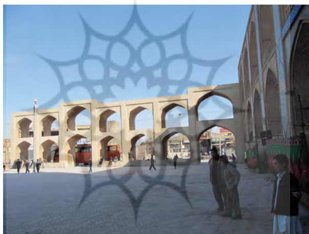
شکل ۴. فضای مناسب تکیه (یا حسینیه) برای برپایی آیین‌ها و حضور در همه‌ی سال