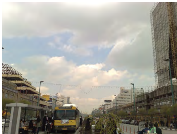
شکل ۳. نمونه‌ای از احداث ساختمان‌های بلند مشرف به حرم رضوی (ع)