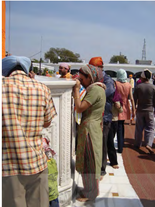
شکل ۹. رعایت آداب ورود به معبد سیکها با پاهای برهنه و سر پوشیده