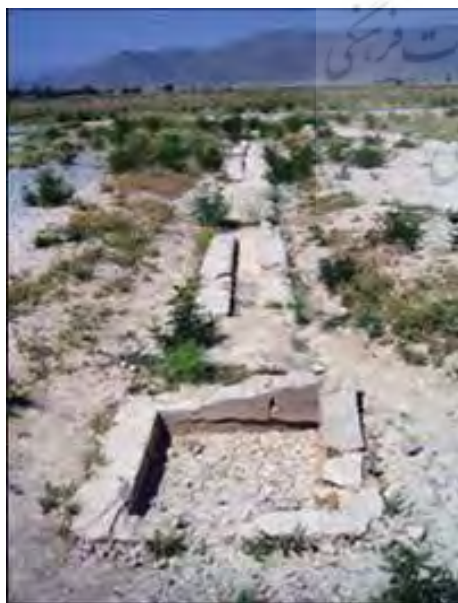
شکل ۱. آب راه پاسارگاد (مأخذ: سمیع آذر، ۱۳۸۶)

قرارگیری در اقلیم گرم و خشک همواره موجب اهمیت ساخت باغ‌هایی بوده که همچون نماد و متذکر بهشت اخروی باعث آسایش و آرامش مردمان این خطه شده است. بنابراین یکی از مهمترین عناصر معماری و شهرسازی ایران را می‌توان باغ‌های آن دانست که با تنوع جهت استفاده اقشار مختلف و در طول سالیان طولانی بدست معماران چیره دست این مرز و بوم ساخته شده و بعنوان یکی از بارزترین یادگارهای