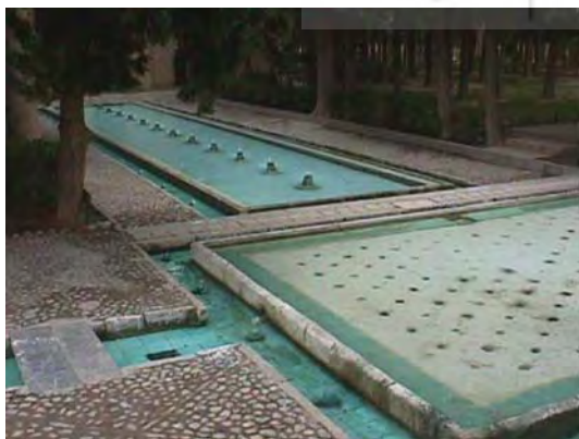
شکل ۲. تقسیم چهار- باغ فین کاشان

از هنگام غلبه اعراب بر ایرانیان در سراسر سده های اسلامی تاکنون، باغ های این کشور در نظر مردم آن نمونه بهشت موعود بوده اند. بی شک علت بوجود آمدن این عقیده در بین آن ها و ارزش زیادی که برای باغ ها قائل هستند، خشکی و بی درختی فلات ایران است. اصل و منشأ جنبه حیات بخش باغ ها به ادوار ابتدایی باز می گردد. از چهار هزار سال پیش از میلاد هنگامی که شکارچیان از کوه ها سرازیر می شدند و در دره های طویل فلات بزرگ ایران به کار کشاورزی می پرداختند، جنبه های مختلف زندگی و معتقدات خود را بر روی اشیای