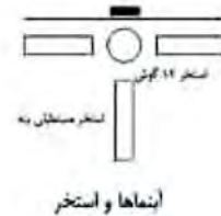
شکل ۳. اجزاء و جزئیات باغ