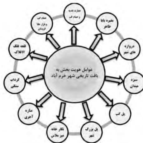
شکل ۴. نمودار عوامل هویت بخش به بافت تاریخی شهر خرم آباد