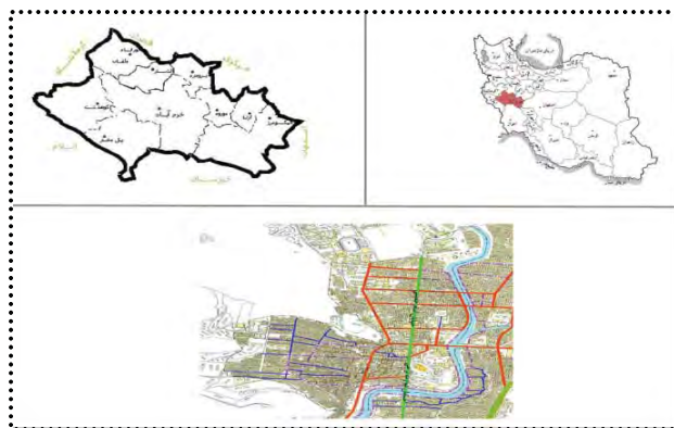
شکل ۱. موقعیت مکانی شهر خرم آباد

هایدگر عنوان نموده است هویت برابری است و پرسش از هویت هنگامی مطرح می شود که بخواهیم دو چیز متفاوت را برابر معرفی کنیم. در دوران مدرن معیارهای معین سنجش سنتی هویت افراد مردود