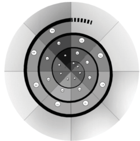
شکل ۲. فرآیند تهیه طرح های ساختاری - راهبردی، تفصیلی پایه، موضعی و موضوعی شهرها

کشور در فاصله سال های ۱۳۶۹ تا ۱۳۷۹ شامل تهیه طرح های توسعه و عمران شهرستان و طرح های ساختاری - راهبردی شهر و طرح های تفصیلی موضعی و موضوعی، به نظر می رسد با تهیه و اجرای طرح های مذکور، راه حل هایی برای مقابله با چالش های موجود در شهرسازی کشور قابل حصول بوده و چشم انداز بهتری برای آینده شهرسازی ایران در این که در زیر به آن ها اشاره شده است، موارد قابل پیش بینی است.