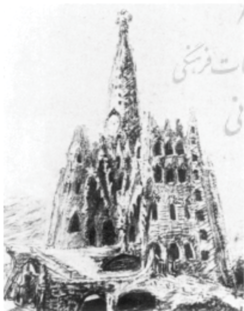
شکل ۴. طراحی گائودی برای کلنیا گوئل (Isaac, 2008, 8)

یکی از روش های طراحی معماری که اولین بار توسط آنتونی گائودی ۱۴ به کار برده شد و بعد از او توسط فرای اتو و بدو راش ادامه یافت، روش یافتن شکل ۱۵ است که از جمله روش هایی ست که نگاهی محتوایی به الگوبرداری از طبیعت دارد. (Otto et all., 1995, 45) بناهای مختلفی توسط این دو معمار با این روش طراحی شده است. برای مثال اکثر سازه های چادری طراحی شده توسط اتو با الهام از غشا صابونی و کشش سطحی طراحی شده اند و یا سازه های شبکه ای که با الهام