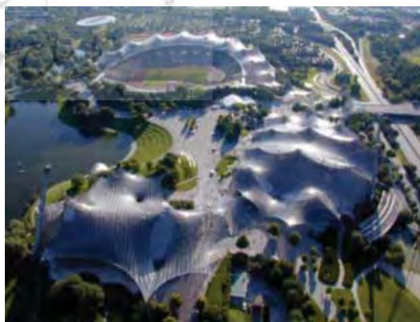
شکل ۳. بام استادایوم المپیک مونیخ طراحی شده به وسیله فرای اتو، با الهام از غشای صابونی و کشش سطحی آن