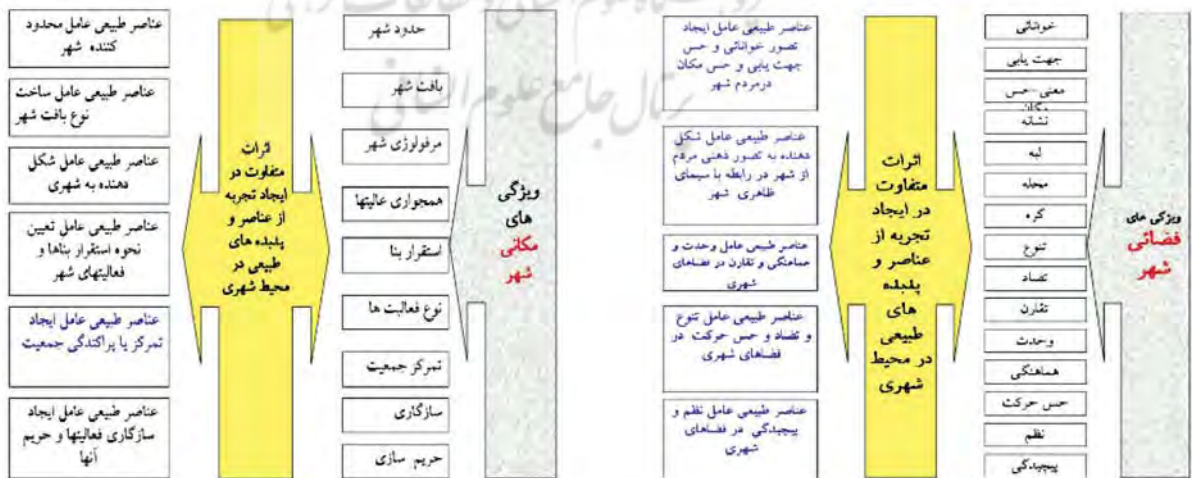
نمودار ۶. نمونه‌هایی از الگوهای تشخیص اثرات پدیده‌ها طبیعی در هویت‌بخشی محیط شهری