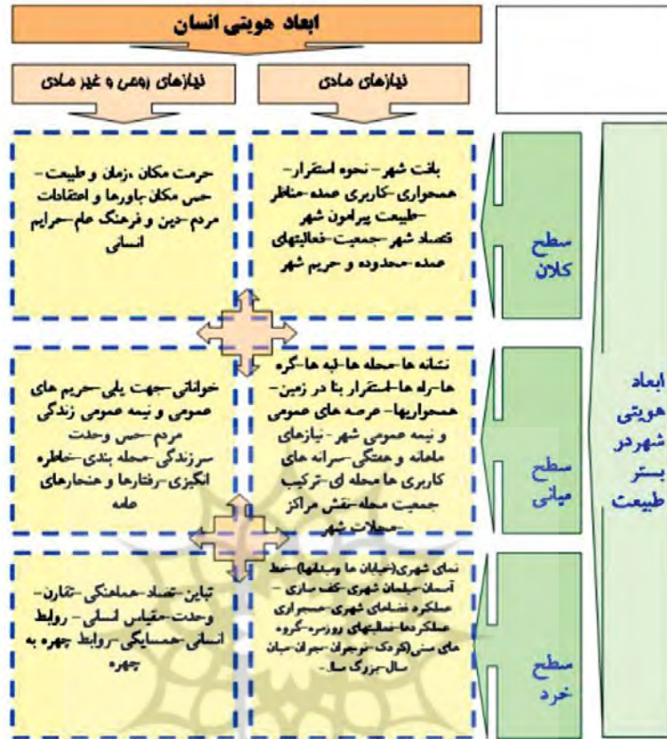
نمودار ۵. تعیین معیارهای هویت‌بخش شهر در رابطه با عناصر طبیعی