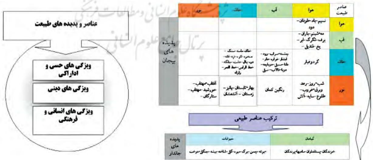
نمودار ۲. ویژگی‌های عناصر و پدیده‌های طبیعی

از ترکیب آنها یک سری پدیده‌های طبیعی بی‌جان و جاندار دیگر آفریده شده است. عنصر هوا، پدیده‌هایی مانند نسیم، باد، طوفان و دود را شکل می‌دهند. عناصر هوا و آب پدیده‌های شبنم، باران، برف، تگرگ، ابر، یخ و قندیل را و عناصر هوا و خاک پدیده گردوغبار را به وجود می‌آورد. عناصر هوا و نور پدیده‌های شب، روز، رعد و برق، رنگین‌کمان، غروب و طلوع، سایه و آتش را خلق کرده و عناصر آب و خاک پدیده‌های چشمه، سراب، رود، آبشار، فواره، غار، دلتا، مسیل، دریاچه، دریا و تالاب. عناصر آب و نور پدیده رنگین‌کمان و عنصر خاک پدیده‌های خاک، ماسه، سنگ، صخره، کوه، تپه، قله، دره، یال، دشت، جلگه، خط‌الرأس، خط‌القعر و شیب را ایجاد می‌کنند. عناصر خاک و نور پدیده‌های بهار، تابستان، پاییز و زمستان و عنصر نور پدیده‌های آفتاب و مهتاب را خلق می‌کند. از نظام‌ها و قوانین حاکم بر ترکیب عناصر چهارگانه طبیعت و فرایندهای حاصل از آنها پدیده‌های جان‌دار طبیعی خلق شده که شامل دو دسته اصلی گیاهان و سپس جانداران است. (نمودار ۱) ویژگی‌های هریک از عناصر چهارگانه طبیعی را می‌توان بر اساس خواص فیزیکی، خواص حسی و ادراکی و یا تاثیرات فرهنگی و دینی آنها طبقه‌بندی نمود. ویژگی‌های فیزیکی عناصر چهارگانه به پدیده‌های طبیعی صفاتی مانند رنگ، بو، شکل هندسی و الگوهای غیرهندسی، حرکت و گردش، حجم و حالت‌های فیزیکی (مایع، جامد و بخار) را ارائه می‌نماید. ویژگی‌های حسی و ادراکی عناصر چهارگانه به پدیده‌های طبیعی صفاتی نظیر جریان و حرکت، سرزندگی، آرامش، دعوت‌کنندگی، جذابیت فضا، حس آشنایی، تقارن، ریتم، پیوستگی،