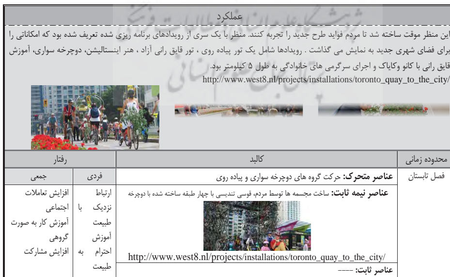
جدول ۳. جمع بندی منظر موقت در اسکله تورنتو

"سو هانگ یان، آدا" ۶ کارشناس ارشد معماری منظر دانشگاه هنگ کنگ در پایان نامه کارشناسی ارشد خود با عنوان "دستورالعمل منظر موقت: به منظور نجات فرصت‌های از دست رفته هنگ کنگ" ۷ منظر موقت را به عنوان راه‌حلی برای استفاده از همه فرصت‌های فضایی و به کارگیری همه توان بالقوه زمین‌های تحت استفاده و رها شده هنگ کنگ و به عنوان اثر "فضای سبز" آنی مطرح می‌کند به طوری که منظر موقت