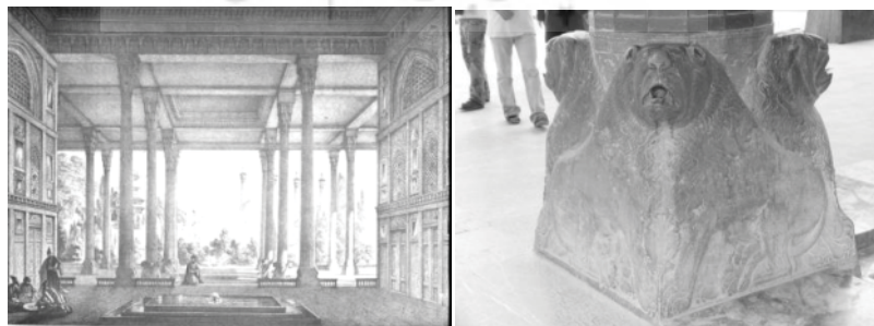
شکل ۴. راست- ایوان چلستون (Flandin et al., 1851) چپ- شیرسنگی پای یکی از ستونها