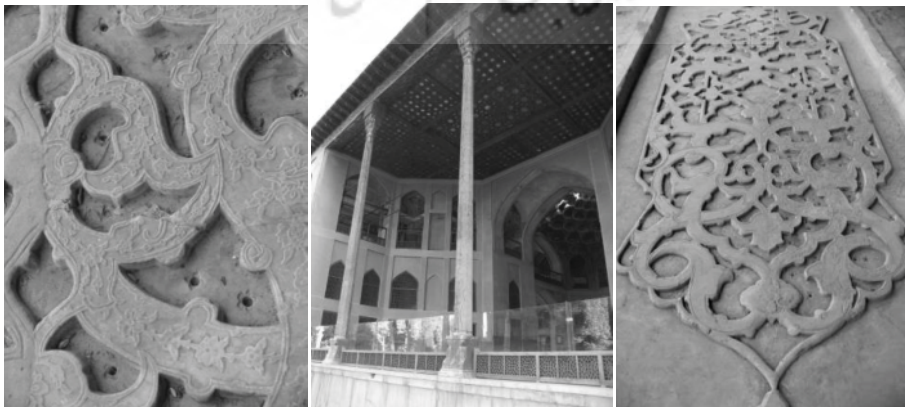
شکل ۳. کاخ هشت بهشت، ایوان شمالی، آسمانه ایوان، حوض و روزن های آب